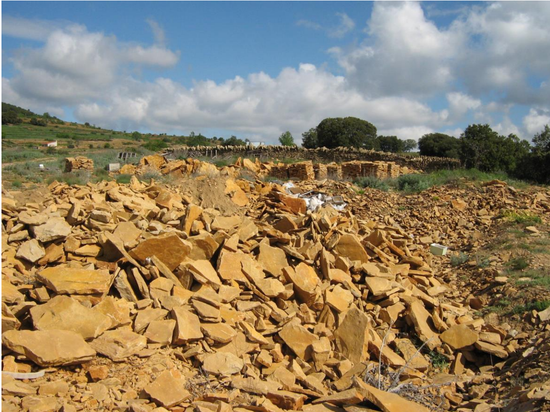
Restos de una explotación abandonada en la Iglesuela del Cid, cerca de la carretera a Vilafranca del Cid

Se ubican sobre afloramientos de calizas arenosas pertenecientes al cretácico. Lo que ocurre es actúan sobre capas muy superficiales, abarcando grandes superficies las explotaciones y poca profundidad. Esto provoca una gran alteración del Medio Natural, ya que a menudo estas explotaciones no quedan suficientemente bien restauradas, causando numerosas cicatrices. Esto se acrecienta, en muchos casos, por el abandono de grandes masas de losetas no aprovechadas, defectuosas