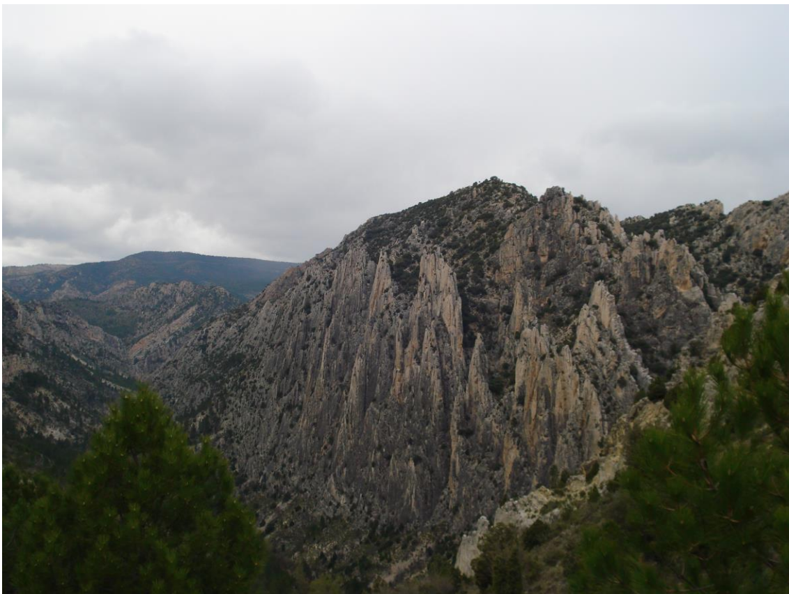
Los Órganos de Montoro (Villarluengo)