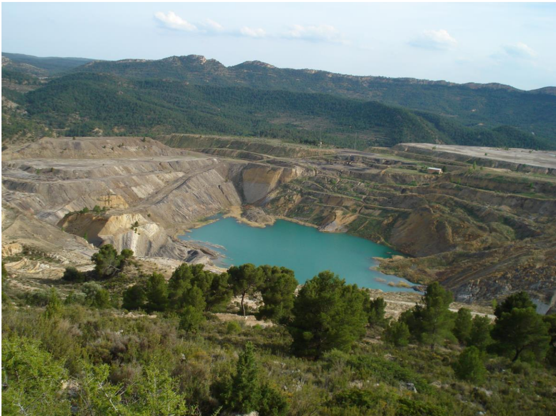
Una muestra de la Corta María Luisa, en parte cubierta de agua

Como en el caso anterior, estas explotaciones se relacionan con afloramientos de los materiales cretácicos del Albiense; pero en este caso pertenecen a la Formación Escucha . Así, en las explotaciones se observan alternancias de los niveles carbonosos (son siempre lignitos) con tramos de caolines y arenas.