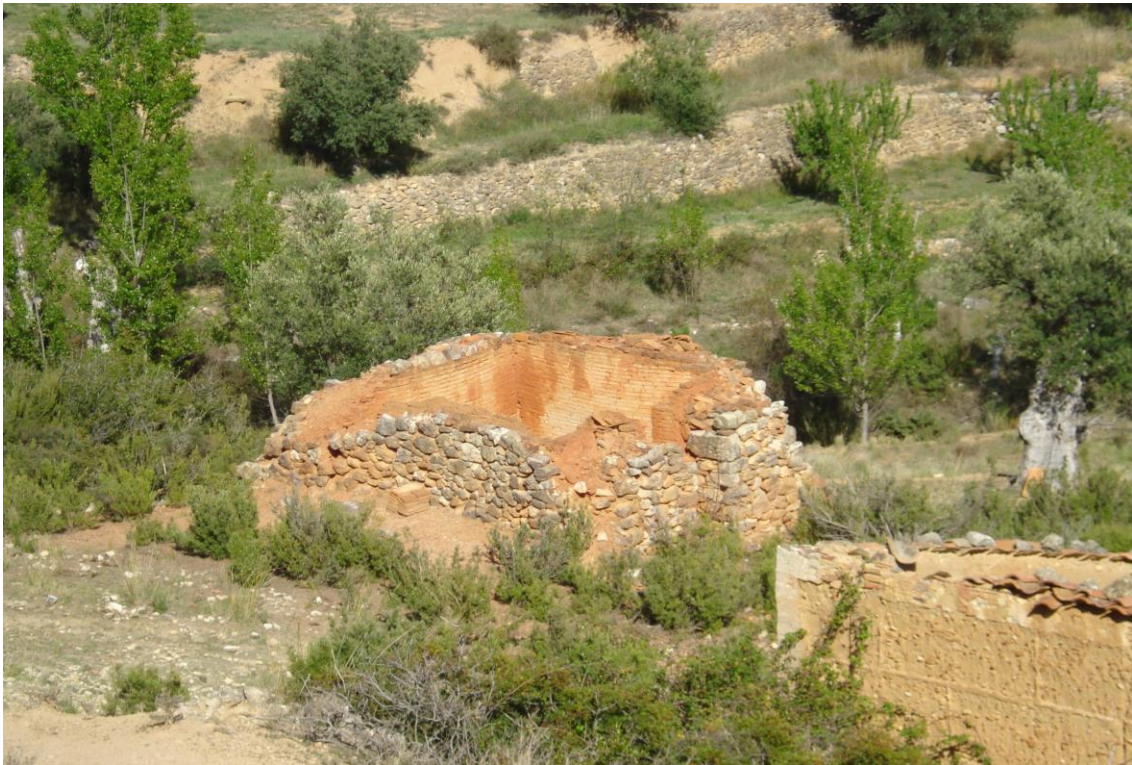
Tejera de la Algecira (Ladruñan, Castellote)

mejores conservadas de la comarca. Al margen de estas, existen algunas otras tejas situadas en Cantavieja (prácticamente derruida), Villarluengo y Dos Torres de Mercader (en un estado de conservación similar a las de Ladruñan).