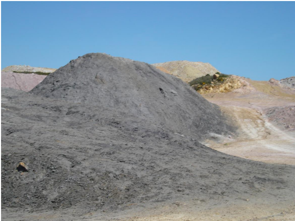
Depósitos de las explotaciones de las cercanías de la Masía del Romano

En todos los casos se trata de la explotación de los niveles caoliníferos (a menudo arenosos) de la Formación Utrillas . Como es sabido, se trata de terrenos terrígenos cretácicos, pertenecientes al Albiense. A menudo se hallan junto a los terrenos de la Formación Escucha , en la que se incluyen niveles lignitíferos. Incluso a veces los caolines son oscuros por la presencia de materia orgánica en ellos.