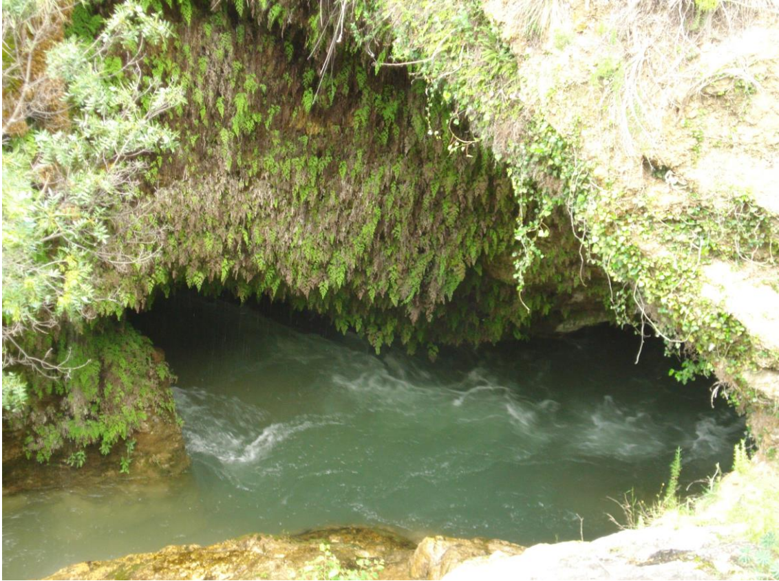
El Puente de Fonseca (Ladruñan, Castellote)

Se trata, pues de verdaderos monumentos geológicos , aptos de ser utilizados para el uso del turismo científico. Actualmente, muchos de estos elementos ya son visitados, con notable éxito. Nosotros recomendamos el establecimiento de algunas rutas, más o menos largas, como las siguientes, a título meramente orientativo: