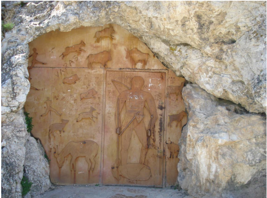
Entrada a la Cueva de Cristal (Molinos)