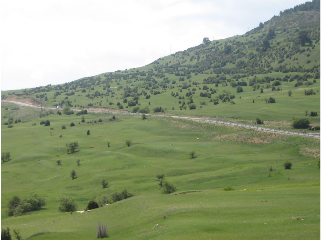
Lóbulos del Cuarto Pelado (Cantavieja)