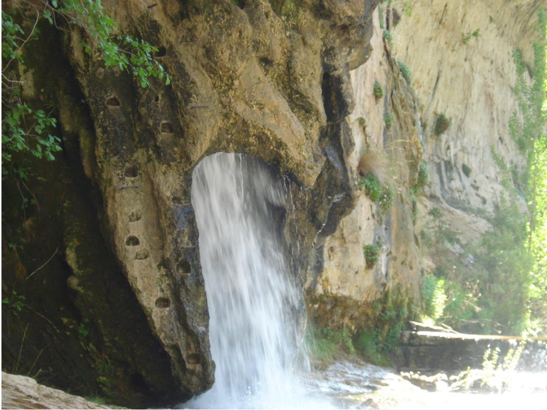
El Chorro del agua en el Nacimiento del Pitarque