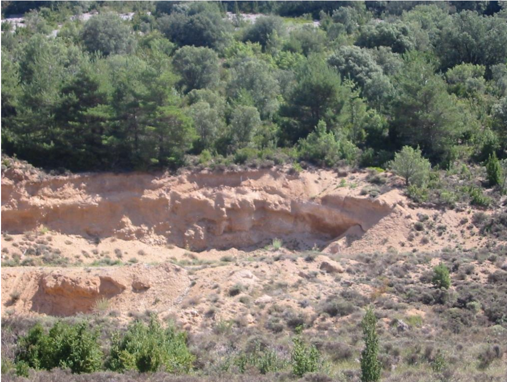
Terrera de Urbiales

Como en el caso de la parada anterior, en este lugar hay una explotación terrígena, de los derrubios de pendiente cuaternarios. Estos materiales se han destinado a la construcción del firme de la carretera.