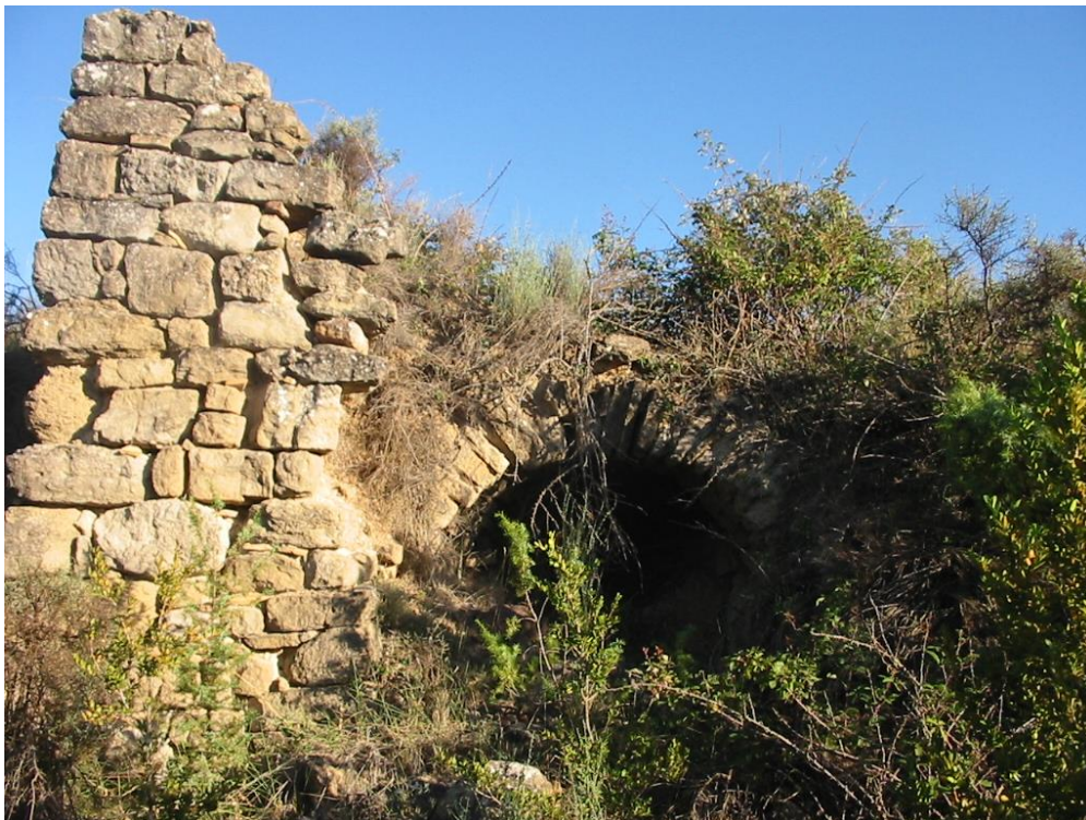
Restos del Tejar de Barcabo

Aquí, hay los restos de un antiguo tejear. Éste no se halla en buen estado de conservación; aunque el horno se halla en relativo estado. Como el anterior, forma parte del Patrimonio Minero del Sobrarbe .