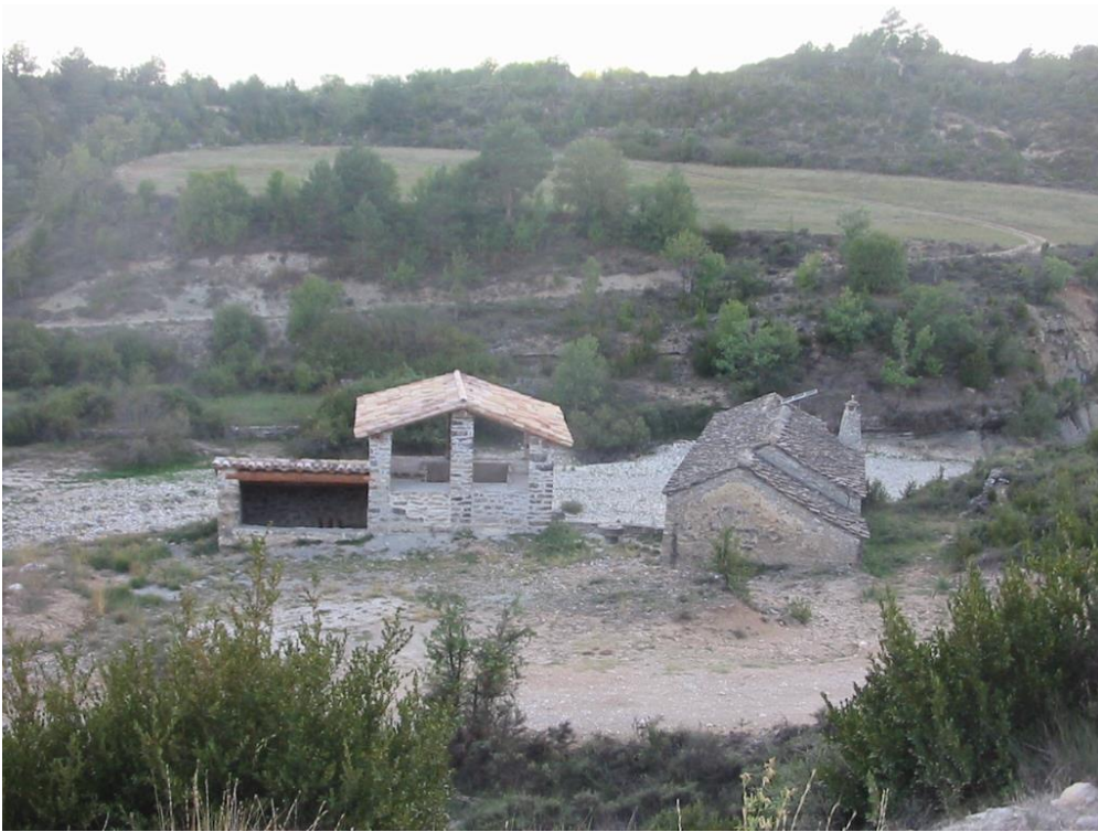
Almazorre (Barcabo): la tejera y la almazara