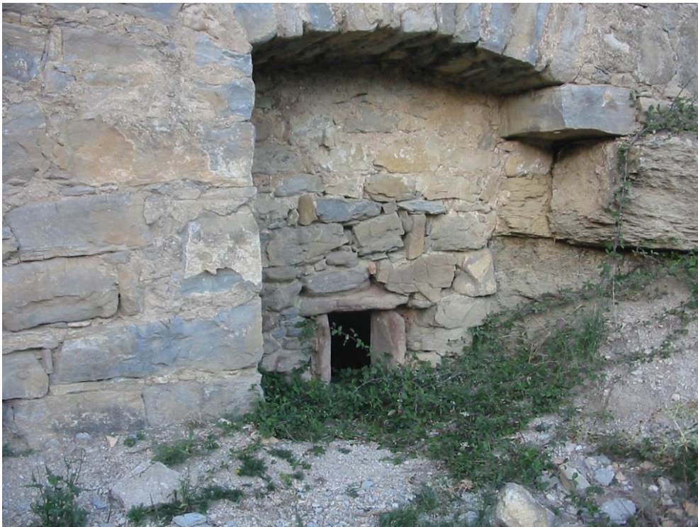
Boca del horno del tejar

Por otra parte, junto al tejar, se ha recuperado también una interesante almazarra (o molino de aceite). Este lugar da, precisamente, el nombre al pueblo.