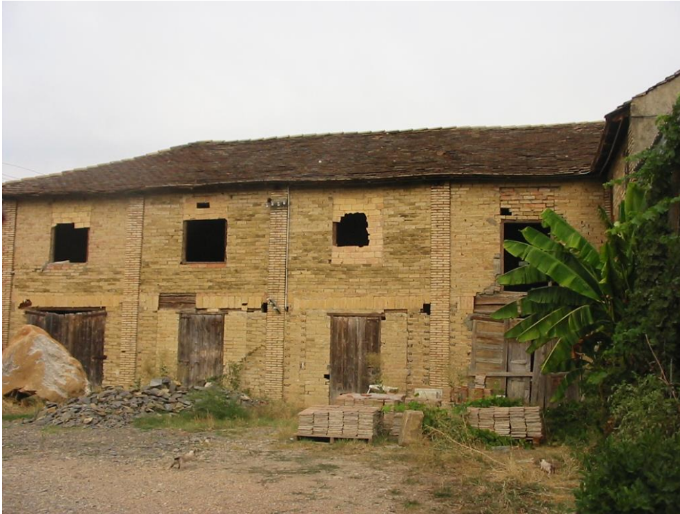
Restos de los edificios de la tejería

En este lugar, en donde efectuamos la presente parada, se hallaba una antigua tejería. En ella se aprovechaban unos materiales calcolutíticos extraídos de las cercanías. Por lo que concierne a la tejería, a pesar de hallarse muy transformada, forma parte del Patrimonio Minero del Sobrarbe .