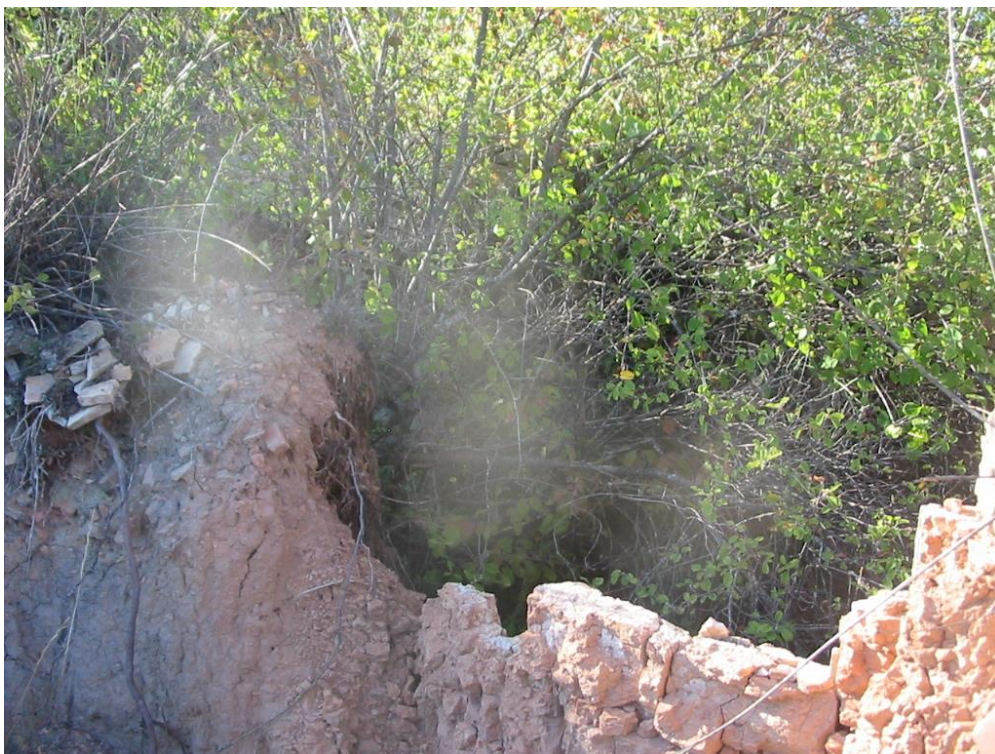
Restos del tejár

El recorrido del presente itinerario, cabe realizarlo en este lugar. Este tejár se halla situado en las inmediaciones de Lecina , a menos de 1 Km al SSE del pueblo. Se accede directamente desde el pueblo por un sendero.