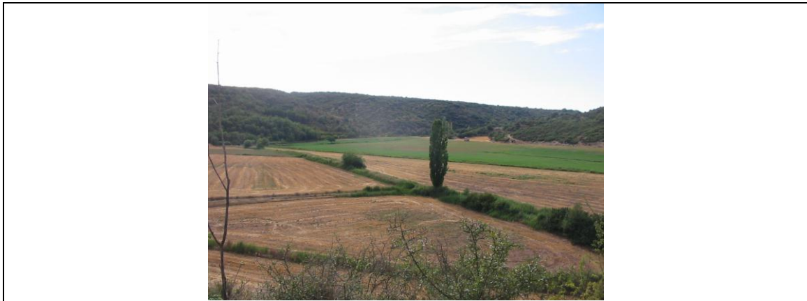
FOTOG. 4. Pla de la Font de les Olles , una antigua laguna de origen kárstico desecada PHOTO. 4. Pla de la Font de les Olles , an ancient dried-up lagoon of karstic origin

Al llegar a este lugar, delante de las explotaciones de calizas acabadas de mencionar, vemos una extensa llanura ( Pla de la Font de les Olles ), que se continúa por otra más estrecha ( Pla del Regué ). En ambos casos se trata de la hondonada de unas antiguas lagunas kársticas, desecadas artificialmente hace tiempo. Como es natural, en el fondo de las mismas se halla una tierra muy fértil, y también es fácil ver sedimentos de turbas.