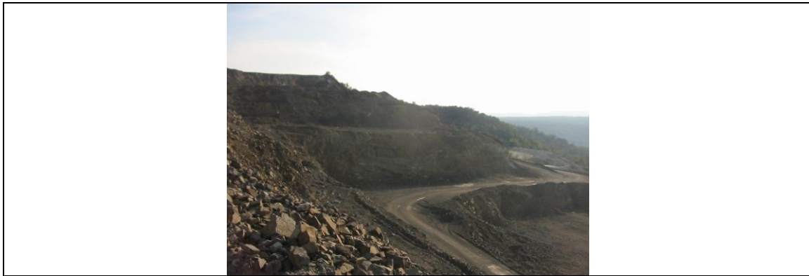
FOTOGRAFÍA 2. Detalle de las explotaciones de ofitas de las inmediaciones de Soriana (Estopiñan del Castillo)

Todo este recorrido, se habrá efectuado por entre afloramientos mesozoicos del Manto de las Sierras Marginales . En buena parte, estos materiales son ahora del Triásico; así habremos encontrado frecuentes afloramientos de los materiales del Keuper, especialmente de arcillas, yesos y ofitas. Precisamente, en este lugar hay un importante afloramiento de ofitas. Estas ofitas se hallan actualmente en explotación, para ser dedicadas a áridos. FOTOGRAFÍA 1.