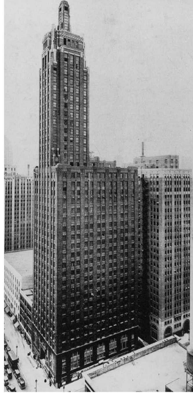
Burnham Brothers, Carbide & Carbon (1928-29)

Després comença una nova història: la cerca d'una forma apropiada pels nous gratacels metàl·lics. El “Pioneer”, Louis Sulli-