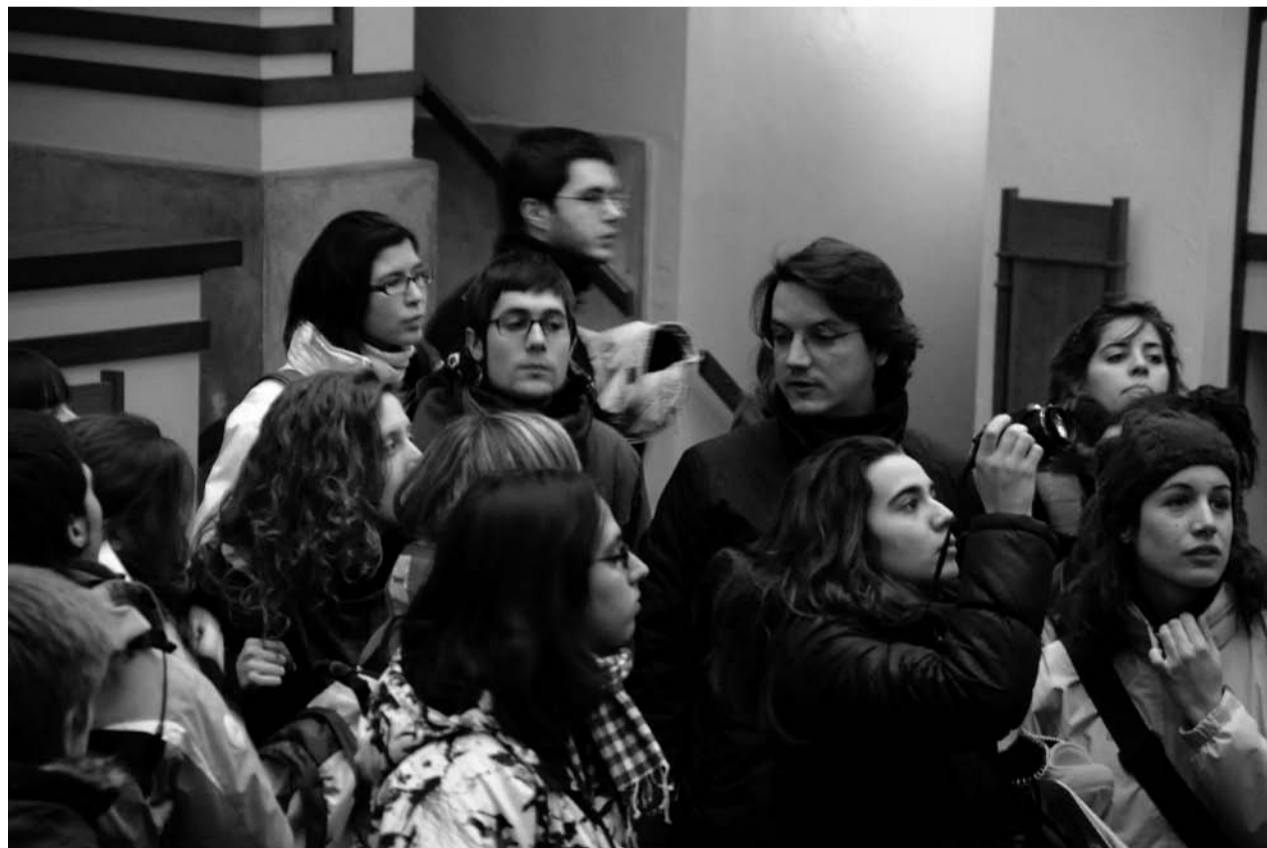
Visita al Unity Temple

Preguntar el que ha agradat a cadascú esdevé molt aclaridor. Naturalment als joves sovint els hi exalta el nou, a nosaltres en canvi també ens enamora el vell que deia el Sr Foix. No som tan ingenus, si parlo per la meua experiència, molts del "ens agrada" no son ben acceptats, coses de iaies, que no estan al lloro. Jo també de jove no mirava la cara de les noies. Segurament un dia, passats els anys, aquestes bombes de rellotgeria explotaran i els faran millors. Tinc la impressió que el meu criteri ha canviat tant que em fa avergonyir dels meus temps passats, i hom no pot evitar de pensar si ara també el meu criteri és incomplet o erroni. Potser sí però no hi fa res, som arquitectes, no crítics, hem de triar l'acció per davant del cagadubtisme estèril o el bonisme elegant. Cadascú ha de ser amo del seu criteri i lluitar cada dia per millorar-lo. Per recitar un manual, millor quedar-se a casa.