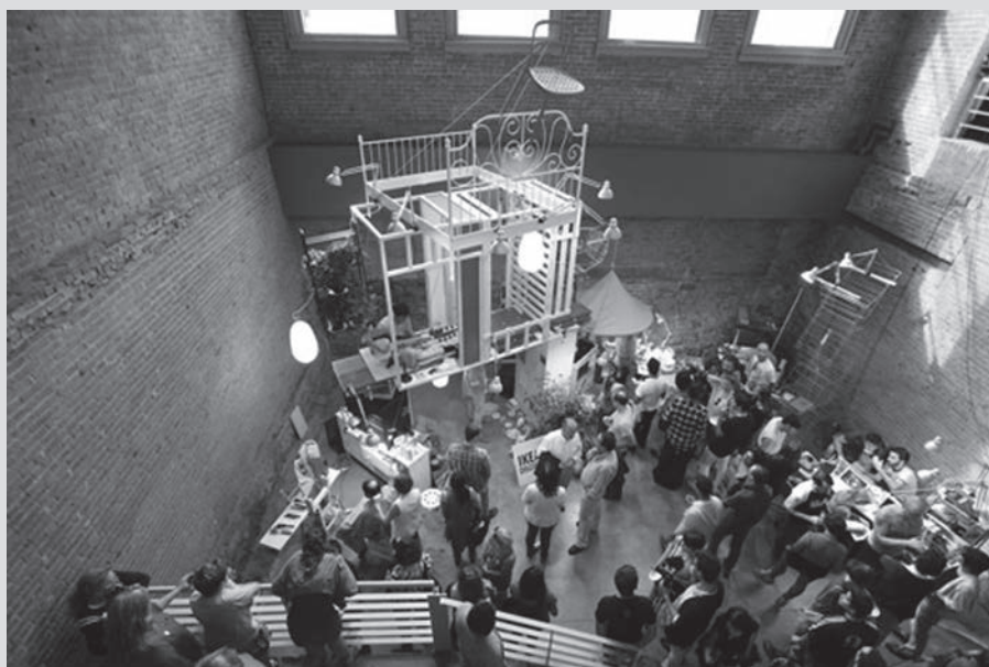
04. CHARLES ROUSSEL. SUNDAY SESSIONS AT MOMA PS1, IKEA DISOBEDIENTS, 16 SEPTIEMBRE 2012.