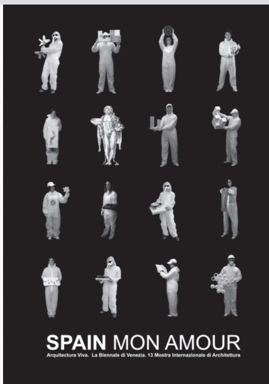
02. KOVAS BOGUTA, TIMELINE DE TWITTER EN ORIENTE MEDIO DURANTE EL CORTE PROMOVIDO POR EL GOBIERNO EGIPCIO, BLOG DEL AUTOR KOVASBOGUTA.COM, FEBRERO 2011. 03. ARQUITECTURA VIVA, SPAIN MON AMOUR, 2012, DOSSIER DE PRENSA SPAIN MON AMOUR.