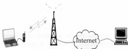
Figura 1. Esquema de una conexión a Internet mediante un terminal móvil

Con el auge de las tecnologías móviles en las últimas décadas, ha aparecido también la necesidad de que el usuario pueda comunicarse a cualquier hora y desde cualquier parte, ya sea mediante servicios de voz o de transferencia de datos (e-mail, acceso a Internet, MMS). La aparición de los servicios de 2.5G y 3G, tales como GPRS o UMTS, ofrecen la posibilidad de proporcionar al usuario acceso a todos estos recursos con las ventajas de la tecnología inalámbrica y con el único requerimiento de que exista cobertura.