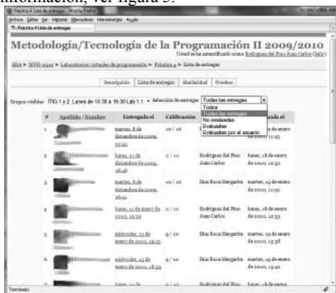
Figura 4. Listado de entregas por alumnos

si comienza por ">>" es un texto preformateado y si comienza por http se genera un hiperenlace. Si en el texto se encuentra una secuencia de la forma "fichero:número", durante el mostrado se genera un hiperenlace a la línea del fichero correspondiente. En una línea de título se puede añadir, al final, una cifra entre paréntesis. Esta cifra representa la penalización que supone ese error. Si la escala de calificaciones es numérica la nota se puede calcular a partir de esta información, ver figura 5.