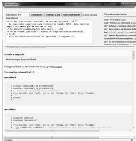
Figura 5. Página de calificación

En cada actividad, los títulos de los comentarios son recopilados para poder ser reusados, pudiendo agregarse a las subsiguientes