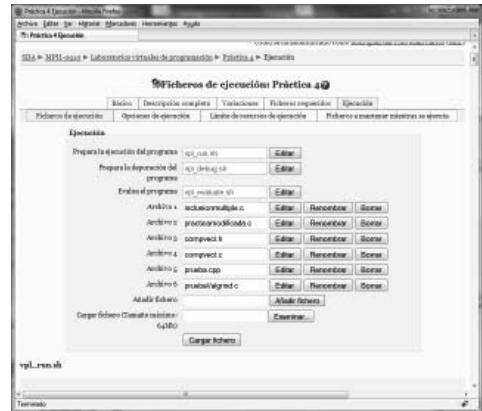
Figura 3. Definición de ficheros de ejecución

Para acotar la ejecución de pruebas y programas, se pueden establecer límites a los recursos empleados: tiempo, memoria, tamaño de ficheros y número de procesos. Estos límites se pueden establecer globalmente para todo el sistema y, particularmente, para cada actividad, limitando, a su vez, las actividades que se basan en ella.