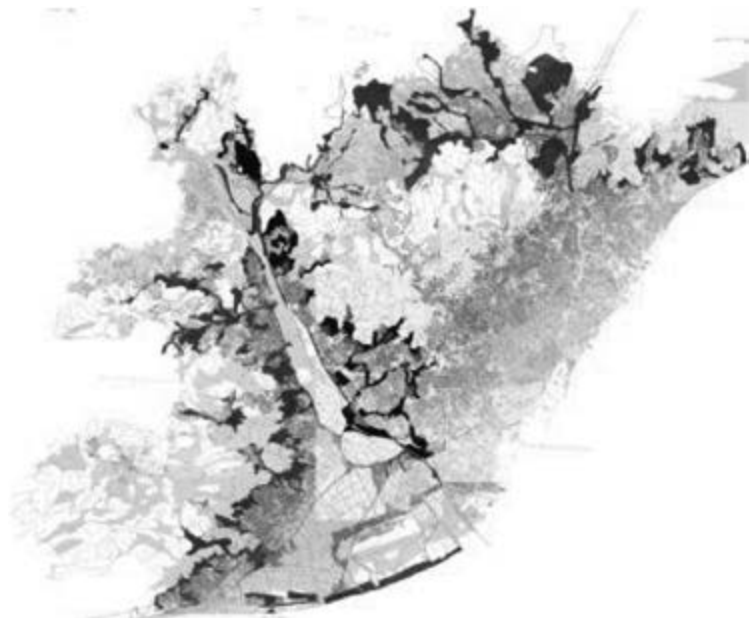
Fig. 1: Proposta d'àmbit de Vora Urbana. Àrea Metropolitana de Barcelona, 2012. R. Quellas, A. Crespo i H. Sanz.

s'entén com a catàleg de situacions concretes, fruit d'una lectura de les diferents categories de les vores urbanes. Es parteix d'un anàlisi territorial per extreure els fragments d'identitat, com a sistemes territorials. Posteriorment, a escala municipal es reconeix l'estructura de vora urbana entre el binomi "ciutat-camp" en forma d'unitats de paisatge i unitats d'actuació urbana i s'identifiquen els planejaments i sectors delimitats no executats que regulen de manera superposada aquests espais de vora. El següent pas de l'estudi arriba a una escala local, on la forma urbana, les activitats i les distàncies curtes, resolen els contactes d'aquests espais de trobada, prenent consciència alhora, de la seva rellevància territorial. L'estratègia territorial neix doncs, d'una banda, per una sèrie de casuístiques de trobada entre morfologia i funció en un lloc concret, una lectura municipal del planejament vigent (sectors urbanitzables, equipaments no executats, àmbits de protecció preventiva, camins, patrimoni, i règims del sòl, parcs urbans i metropolitans, infraestructures planificades, rieres i vegetació, entre d'altres) i la mirada integral al territori i als seus sistemes.