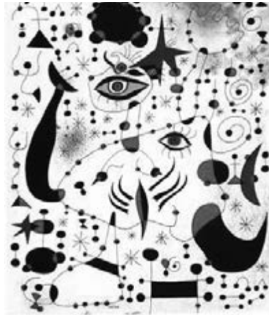
Fig. 6: Constel·lacions. Joan Miró. 1941

Aquesta membrana híbrida que constitueix l'espai de vora, precisa d'una regulació diferenciada i exclusiva pels seus espais i per les seves casuístiques, ja que són peces territorials que defineixen el nostre territori.