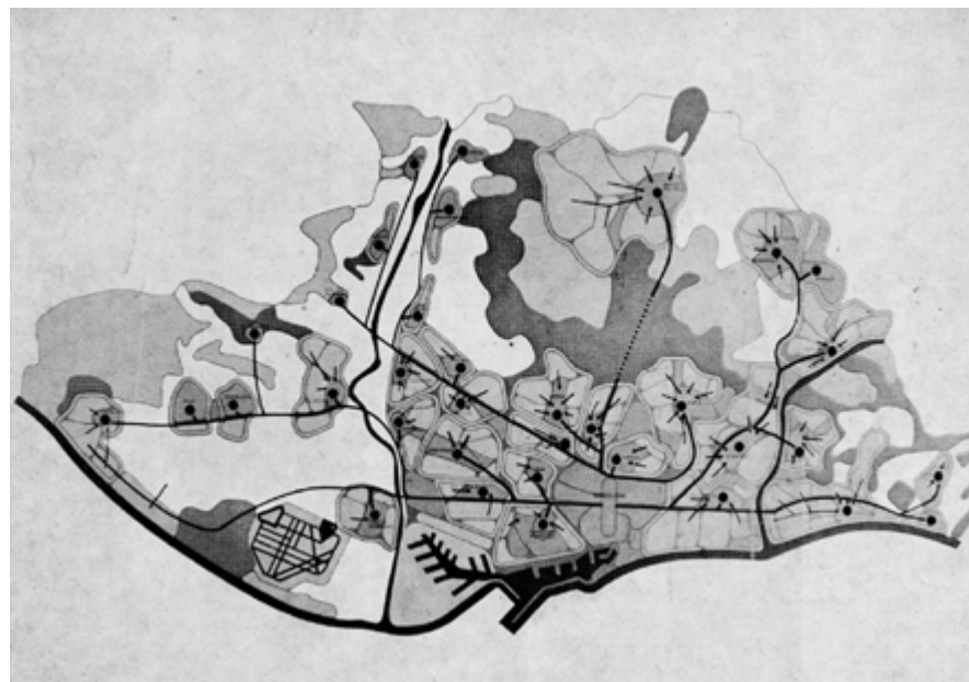
Fig. 4: Pla Comarcal de Barcelona. 1953 (Font: M. Galera, F. Roca, S. Tarragó 1982)