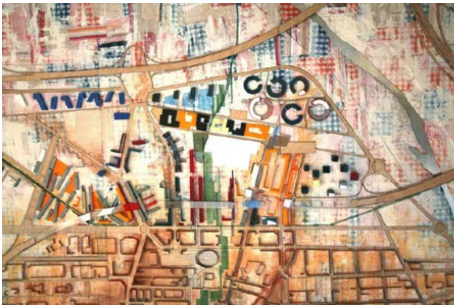
Fig. 8: Projecte Concurs Prat Nord 6+6. Imatge de la maqueta. (Manuel de Solà Morales)

La negociació d'aquests espais de contacte passa per entendre la interacció entre aquestes dues pells, en clau d'equilibri dinàmic, ja que les relacions no són estrictes i rígides sinó, que cada lloc escriu i reescriu les seves vores amb el pas del temps i consolida les seves pells. Les vores urbanes tenen especial interès també, per l'intercanvi i la coexistència de sistemes urbans i mediambientals en un lloc en concret, i a la seva interrelació territorial. M.A. Bartorila, 20 es refereix als ecotons urbans quan parla "d'aquestes àrees d'interfases on diversos ecosistemes naturals i urbans es troben i són possibles articuladors de la ciutat". Però dins la vora urbana, es troben ecotons de diferents característiques i de diferents formes, que conjuntament structuren diferents espais d'alta complexitat ecològica i urbana.