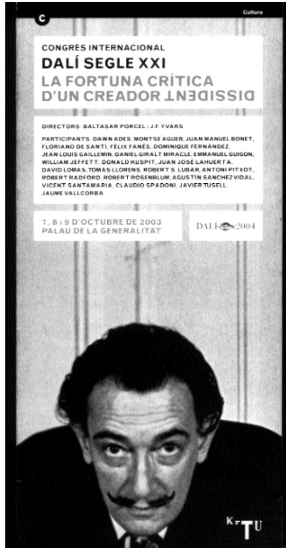
PORTADA DEL TRÍPTIC DEL CONGRÉS