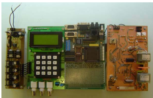
Fig.1 Sistema de pràctiques de 16 bits