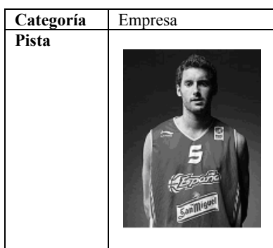
Figura 1. Reto número 1

cercanía de los Juegos Olímpicos y de su pase a la NBA.