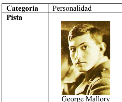
Figura 2. Reto número 2

El segundo de los retos fue el mostrado por la Figura 2. En este caso, además de la fotografía del personaje aparece su nombre, dado que es poco probable que por su imagen se conociera quién era.