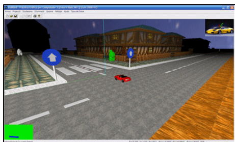
Figura 2. Imagen del proyecto simulador realizado por los alumnos.

En la figura 2 se muestran uno de los trabajos realizados por los alumnos, en el curso 2006-07, en el cual diseñaron varias escenas urbanas con semáforos y señales a configurar. La aplicación permite al usuario la conducción del coche con la visualización del cuadro de mandos (agujas de velocidad, potencia motor activos), indicándole si realiza alguna infracción.