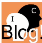
Figura 2. Logo del Blog Intangible Capital

Los contenidos del BlogIC! se estructuran en distintos post , orientados a la participación colectiva, donde lectores, autores, revisores, etc., interactúan mediante la incorporación de comentarios, que posteriormente pueden ser leídos por todos los visitantes, contribuyendo también a la transferencia de conocimiento.