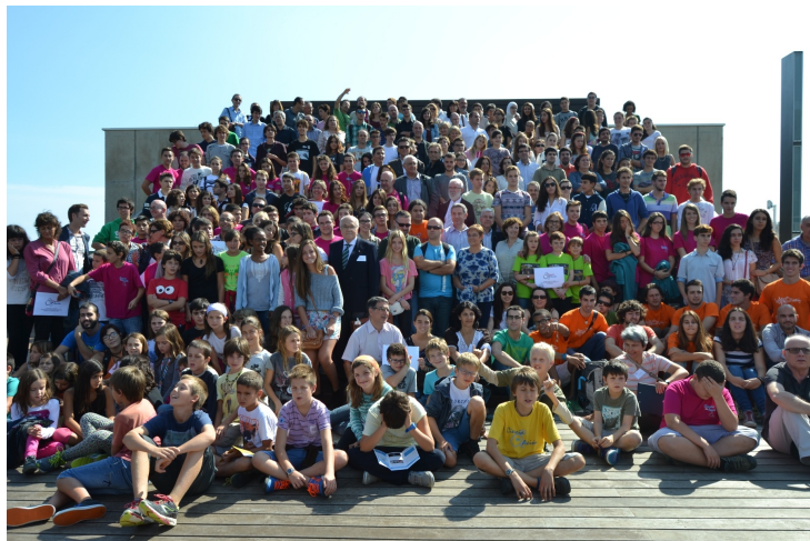
Foto de grupo de participantes en la final CeA 2014.