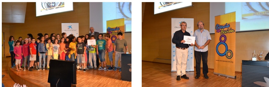
Imágenes de la entrega de premios en el acto de clausura.