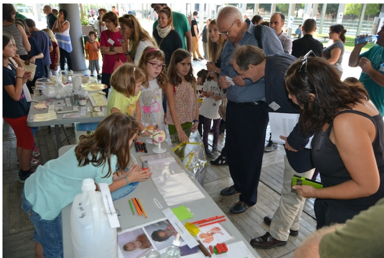
Escolares de primaria explicando al jurado sus experimentos.