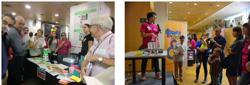
Muestra de actividades prácticas en un stand y en la zona de demostración.

años tendrás en el 2025? ¿Cómo será el mundo entonces? , tuvo tanta afluencia que desbordó el salón de actos y se tuvo que habilitar una sala adyacente. La ceremonia de entrega de premios repasó todas las modalidades, repartiendo primeros premios y menciones, entre aplausos y la emoción de los ganadores y el público en general. Destacó la presencia de numerosos grupos escolares que vitoreaban a los premiados, incluso si estaban en la sala adyacente. En el anexo se incluye la lista de premiados, clasificados por modalidades.