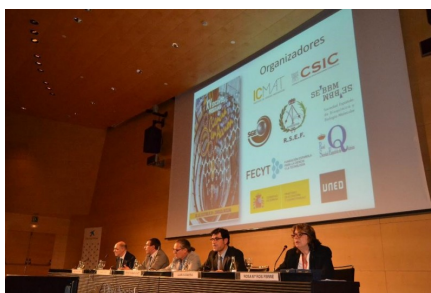
Programa y presentación de la final de CeA 2014.