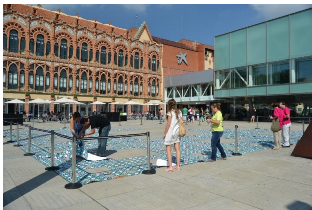
CeA en el CosmoCaixa de Barcelona: construyendo un fractal gigante.

Una doble celebración de aniversario con centenares de protagonistas: niños y niñas, jóvenes, profesores, divulgadores e investigadores, con los miembros del jurado y de la organización, irradiando ciencia viva en los 30 000 m 2 del CosmoCaixa. Por un lado una feria de ciencia con multitud de experimentos, demostraciones, paneles y explicaciones en las decenas de stands repartidos por el museo. Por otro lado CosmoCaixa, la renovación del Museo de la Ciencia de la Obra Social la Caixa que abrió sus puertas en septiembre de 2004, después de restaurar el edificio modernista, obra de Josep Domènech, y ampliarlo con instalaciones modernas basadas en acero y cristal.