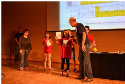
Stands de actividades prácticas in situ e imagen de una puesta en escena.

El Concurso Adopta una Estrella tiene como objetivo despertar y fomentar el interés de los jóvenes por el mundo de la Astronomía. Este programa se presenta en tres modalidades, para grupos de alumnos coordinados por un profesor.