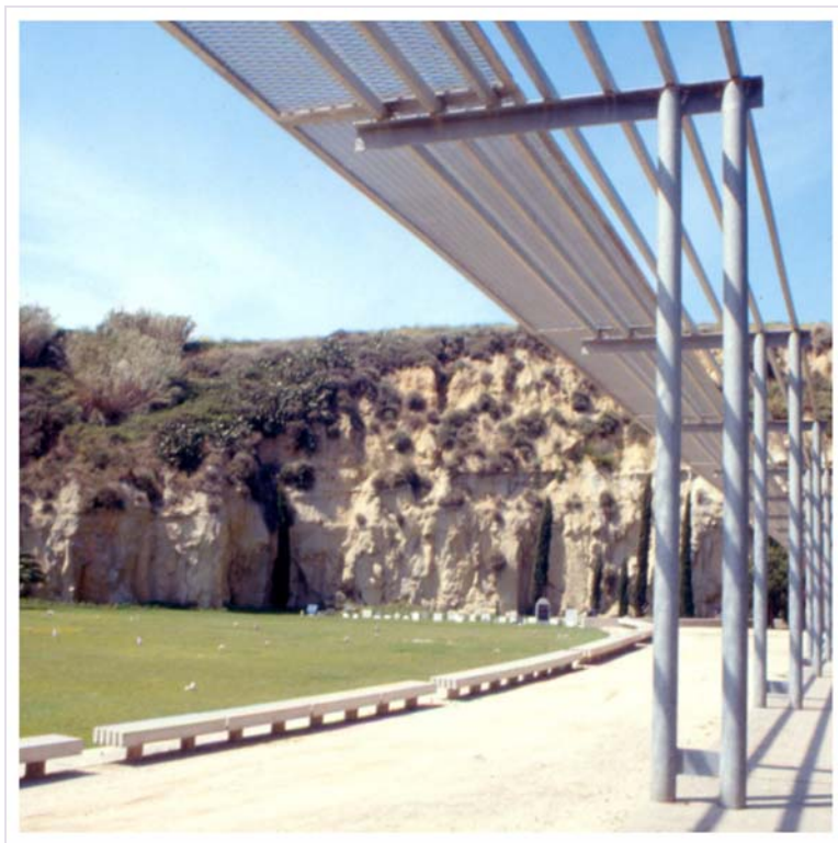
Foso de la Pedrera, correspondiente a la antigua cantera Moragues.

Sin embargo, la larga historia entre ciudad y montaña devino compulsiva, sometida entre el amor y el odio. Por su singularidad, como un símbolo de relación entre el cielo y la tierra, así como por sus condiciones de defensa, y de amplia visión y dominio territorial propiciaron que, en Montjuïc, los íberos establecieran el primer asentamiento humano importante del que se tiene constancia. Y es de suponer que, por las dificultades de establecer el comercio en la montaña y por los problemas de comunicación y transporte debido al accidentado relieve, se construyera más tarde la ciudad romana del Táber. El asentamiento ibérico de Montjuïc se fue romanizando y convivieron dos Barcelonas, la Barcino del Táber y la Laye de Montjuïc, hasta que se abandonó esta última. A partir de entonces, y durante largo tiempo, Montjuïc fue una montaña lejana que acogió poco más que actividades agrícolas y un cementerio judío al que debe su nombre.