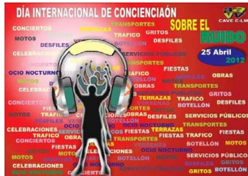
Fig. 1 a 4. Diversos carteles anunciadores del día internacional de concienciación contra el ruido.

El paisaje sonoro no es sólo la expresión sonora de cada lugar, sino que este lugar tiene memoria y recuerdo a través del sonido. Tenemos una memoria sonora que condiciona en cierta manera nuestra manera de ver el mundo y configura la memoria colectiva de los lugares.