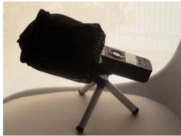
Fig. 9 grabadora digital zoom H1

El coste de la grabadora (nueva) ya se encuentra en el mercado por debajo de los 100 euros. Fig. 8.