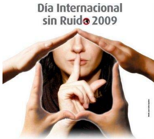
"Día Internacional de Concienciación sobre el Ruido" Miércoles, 29 de abril de 2009 A las 12 horas: mantener "60 segundos" de Silencio (-) menos RUIDO (+) más CONFORT

naturaleza, puesto que casi todo cuanto no nos interesa, aunque no nos moleste, lo catalogamos como ruido.