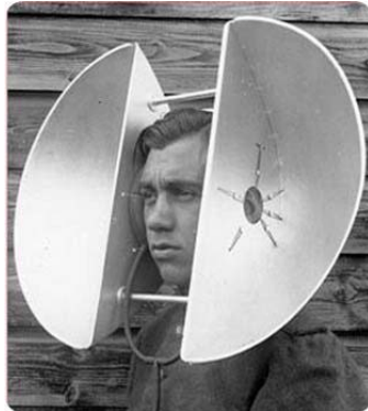
Fig. 6 Homenajes a Murray Schafer

Periódico La Jornada, Lunes 22 de julio de 2013, p. 13