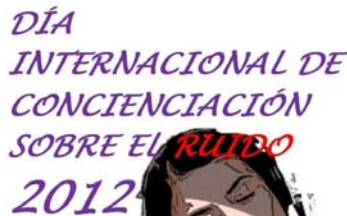
Miércoles, 25 de abril de 2012 www.sea-acustica.es