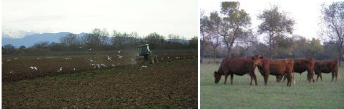
Fig 5.- La actividad agraria.

requiere diálogo y trabajo conjunto y defienden una revalorización del rol del agricultor. Más allá de su actividad productiva, reclaman que se valore su papel en la protección del paisaje y en la función de conectividad ecológica y territorial.