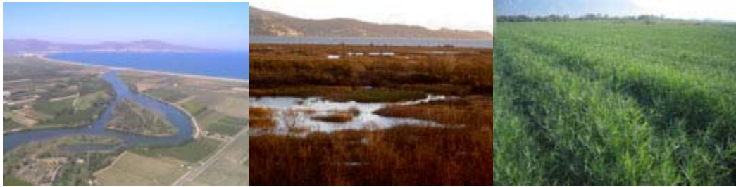
Fig. 3. Las lagunas litorales y los arrozales.

A parte de estas funciones ligadas a la conservación -por su papel de hábitat y de protección- y a la producción agrícola, el parque y sus proximidades también ofrece una función recreativa relevante y diversa. Cada año el parque recibe miles de visitantes y sus playas son concurridas por un turismo de sol y playa y por practicantes de deportes náuticos. Y de manera testimonial, desde los cotos locales aún se mantiene actividad cinegética.