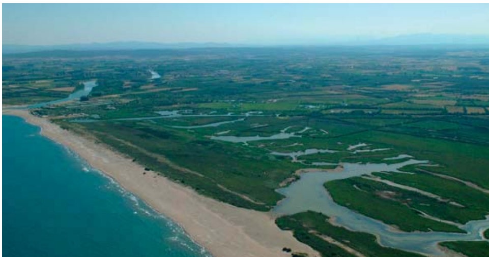
Fig 2. – Reserva Natural Integral de les Llaunes

El elevado dinamismo de estas tierras bajas respecto al nivel del mar genera hábitats muy ricos, diversos y de gran importancia ecológica pero a su vez muy frágiles y complejos. Los 10 km de franja marítimo - dunar incluye marismas, cordones de dunas y playas. Sin embargo, algunos de estos arenales han sido degradados por la acción del hombre debido principalmente a la expansión urbano-turística.