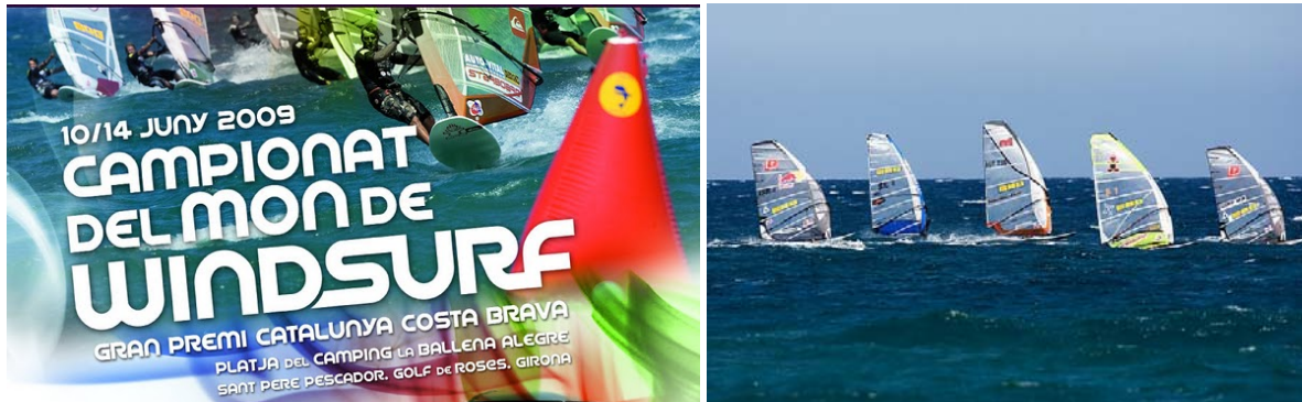
Fig 6.- Actividades náuticas en la playa de Sant Pere Pescador.

Desde estas actividades turísticas y recreativas, tanto las que se desarrollan en la playa como las del hinterland, reclaman un reconocimiento que su actividad también contribuye a la protección del área, tanto porque desarrollan una actividad blanda sobre el territorio como porqué atraen un tipo de turista concienciado y responsable.