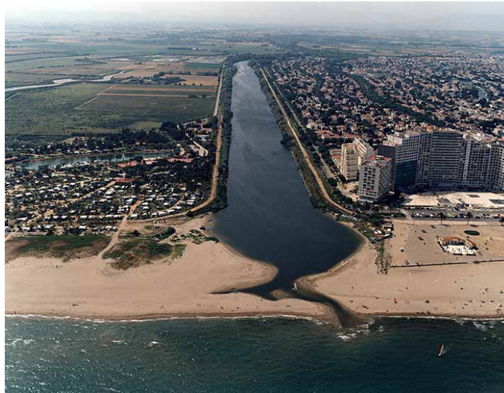
Fig 4.- Límite entre el parque y la urbanización de Empuriabrava.

Fluviá. El resultado del informe señala que ésta región tiene un gran interés y merece ser protegida. A partir de este momento el plan urbanístico de Port Llevant queda invalidado.