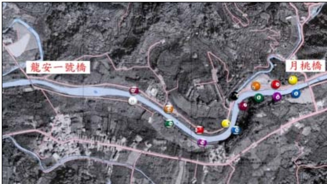
圖 1. 樟平溪調查樣區位置圖

完成一年以上之地點進行調查，各工法之間隔至少50公尺以上以免彼此干擾。於選定之施工或未施工護岸，隨機取一條垂直於溪流之穿越線，一端為護岸與河床的交界處，另一端則延伸至護岸頂端或與道路交接處，沿穿越線進行植生種類與覆蓋度、重要值之調查。本研究共計於樟平溪調查16個穿越線樣區(圖1)，而調查時間則由91年10月6日至當月20日止，於晴天的日間進行。