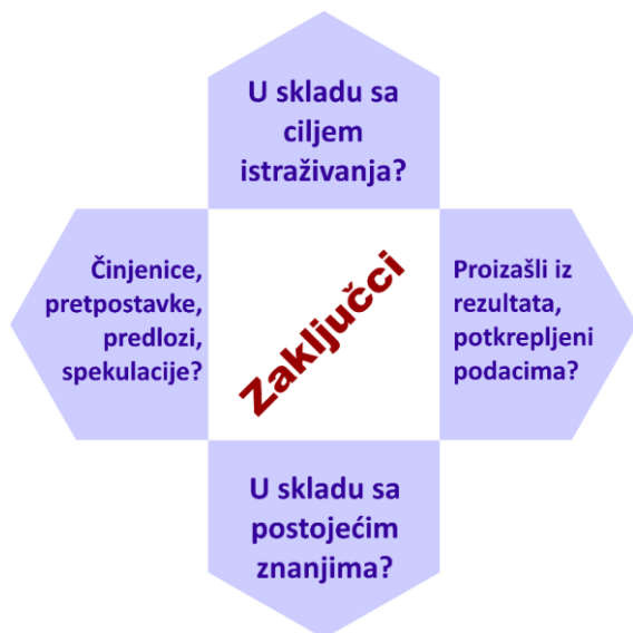
Slika 5. Šta je važno kada se ocenjuju zaključci rada?

Deo rada koji sumira istraživanje i njegove rezultate, koji izvlači „višu vrednost“ iz podataka, su zaključci. Oni moraju biti jasno saopšteni, direktno povezani sa postavljenim ciljem istraživanja i da logično proističu iz prikazanih rezultata, potkrepljeni podacima, kao i da su u skladu sa postojećim znanjima (slika 5). Zaključci moraju biti zasnovani na činjenicama. Ako su iznete pretpostavke, moraju biti jasno izložena ograničenja, uz objašnjenje šta pretpostavku onemogućava da postane tvrdnja. Spekulacije i nagađanja nisu poželjni. Od recenzenta se očekuje da profiltrira zaključke donete na čvrstim osnovama od onih koji su više u domenu subjektivnog osećaja autora. Čitanjem izvoda i zaključka, čitalac mora imati jasnu sliku zašto i kako su istraživanja izvršena i koji je doprinos tih istraživanja nauci.