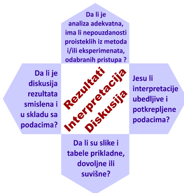
Slika 4. Šta je važno pri oceni rezultata? Figure 4. What is important in evaluating the results?

Suština rada nalazi se u ovom delu i on zahteva najdetaljniji pregled i ocenu. Rezultati moraju biti jasno i logično prikazani, njihovo praćenje jednostavno, interpretacija ubedljiva i potkrepljena dokazima, a diskusija smisljena i u skladu sa polaznom hipotezom i ciljem rada. Slike i tabele treba da su prikladne za razumevanje poruke autora, bez nepotrebnih detalja, ali i sa dovoljno detalja da bi se rezultat razumeo (slika 4). Smatra se da je ljudskom oku i umu najlakše da prati rezultate prikazane slikom i da tabelarno treba prikazati samo one podatke koji se ne mogu valjano predstaviti grafički. Na recenzentu je da proceni mogu li se rezultati prikazati bolje nego što je to učinjeno.