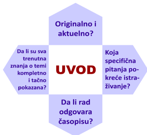
Slika 2. Šta je važno kod ocene uvoda rada? Figure 2. What is important about the assessment of the introduction of the paper?

Na osnovu uvoda treba, takođe, oceniti da li tematika istraživanja odgovara tematici časopisa. Ako ne, ako je rad „Out of scope“, recenzent to treba da saopšti uredniku, čak i bez daljeg čitanja rada i recenziranja i da, eventualno (nije obavezno, ali jeste preporučljivo) autorima sugeriše prikladniji časopis. Ako časopis praktikuje transfer radova, ovakva sugestija može pomoći u preusmeravanju rada i uštedi vremena, uz saglasnost autora.