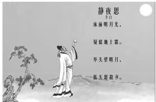
图 2 古诗动画生成系统示例 Fig. 2 Examples of intelligent multimedia display system for classic Chinese poetry