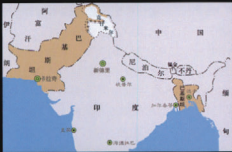
1947年印巴分治形势图

印度、巴基斯坦、孟加拉国原为同一个国家，随着英国的入侵和占领全境，于1859年沦为英国殖民地——英属印度。1947年6月，为解决存在多年的宗教冲突，英国最后一任总督蒙巴顿公布了印巴分治方案，根据方案，巴基斯坦由东、西两部分组成，中间为印度所隔，两地相距2000公里，同年8月14日巴基斯坦宣布独立。然而，东、西巴基斯坦两地居民的语言、文化、民族不尽相同，它们共同的基础仅仅是伊斯兰教。地理上的相互隔绝，文化上的巨大差异，飞地因素产生的强大离心力，终于导致东巴基斯坦在1972年1月脱离母国，成立了孟加拉人民共和国。