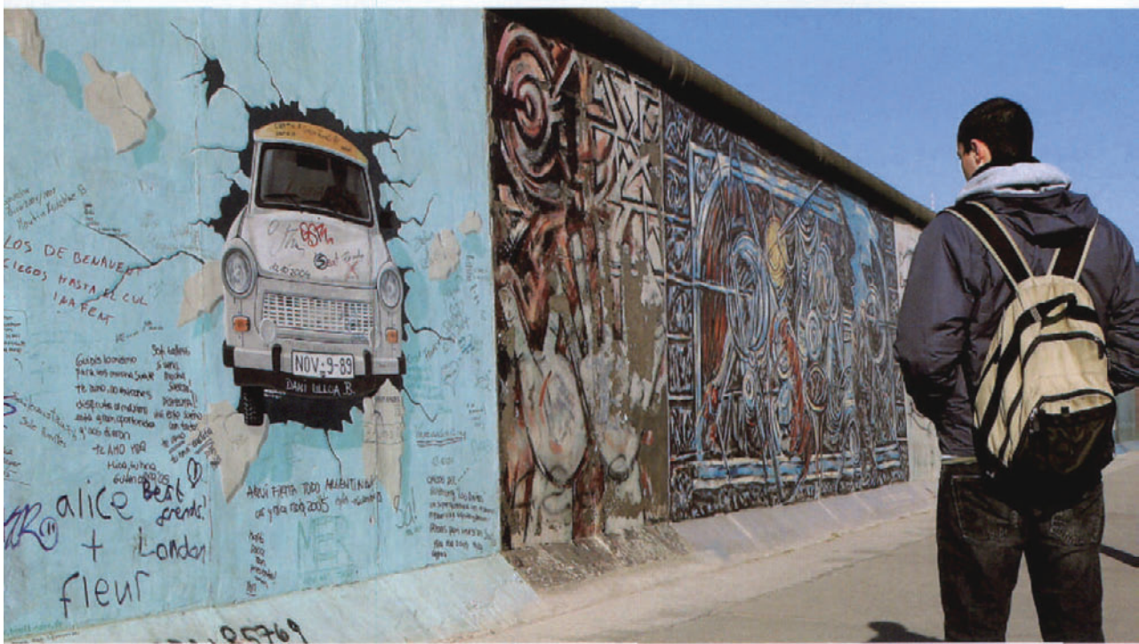
2005年3月30日，德国柏林，行人经过柏林墙的残留遗址