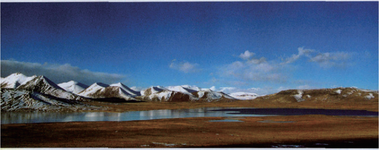
青海省海西蒙古族藏族自治州的飞地境内，6621 米的唐古拉山最高峰各拉丹冬雪山，孕育了万里长江正源沱沱河

堡邦相隔。在我国，河北省的三河市、大厂回族自治县、香河县隶属于廊坊市，但与廊坊市之间却隔着北京和天津两个直辖市辖区，成为河北省嵌入京、津二市之间的一块飞地。贵州省黔东南苗族侗族自治州天柱县所辖的地湖乡，位于湘西南的会同县境内，该乡靠近黔湘省界，但却不与