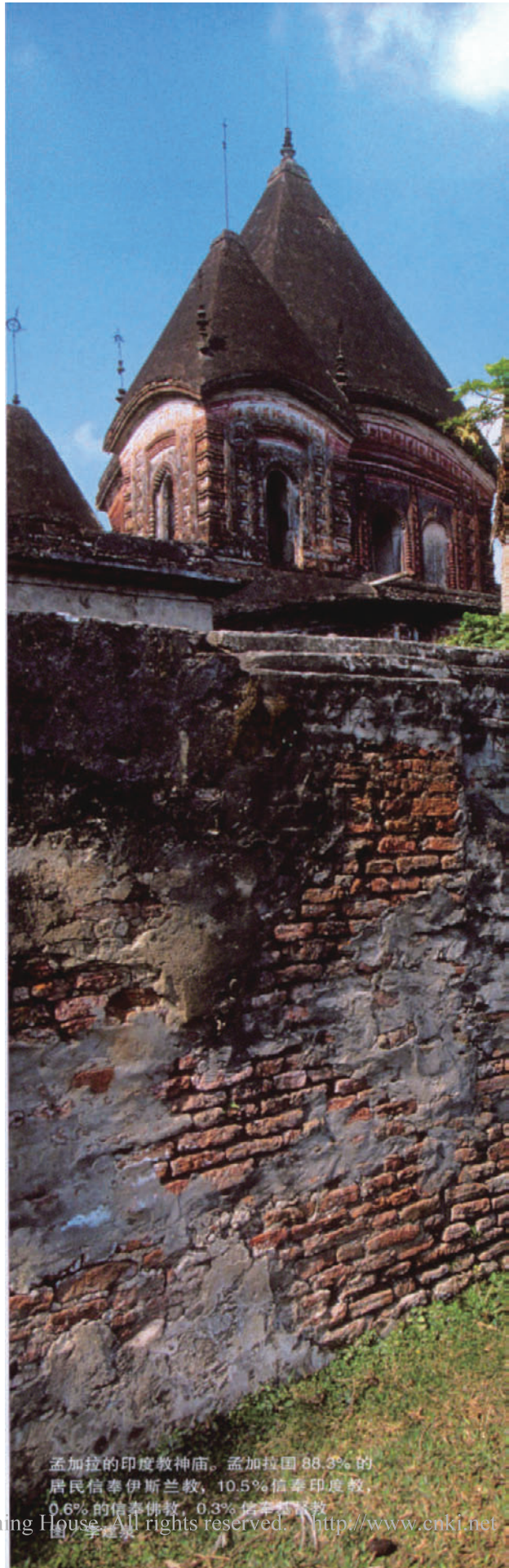
孟加拉的印度教神庙。孟加拉国88.3%的居民信奉伊斯兰教，10.5%信奉印度教，0.6%的信奉佛教，0.3%信奉基督教。