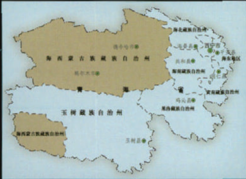
海西蒙古族藏族自治州位于青海湖以西，北接甘肃，西邻新疆，其飞地位于青海省西南隅，邻接西藏自治区，北为可可西里山，南为唐古拉山

中国早期的飞地多出自政治原因。在古代的分封制下，无论是国王分封诸侯国，还是诸侯分封采邑（中国古代诸侯封赐所属卿、大夫作为世禄的田邑，即封地），都属于随事更置，在地域上比较随意，不一定讲究畛连疆接。尤其是采邑，因地域较小，往往用作赏赐，一家可得多处，所以到战国时期，采邑领地就已插花交错，而诸侯国之间的军事征战、土地互换，使得疆域更加难以完全厘清，飞地行政区的出现也就在所难免了。