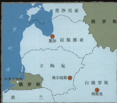
俄罗斯的飞地加里宁格勒州

该州首府加里宁格勒市是俄重要海军基地，波罗的海舰队司令部所在地，不仅是俄罗斯通往欧盟的窗口，也是与北约对抗的政治最前沿，具有更加重要的地缘政治和军事战略意义，俄媒体曾形象地将加里宁格勒称为“俄罗斯楔入北约的一颗钉子”。