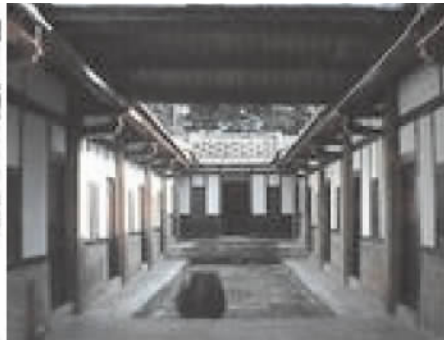
图 4 金门某民居过水廊