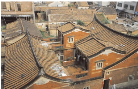
图 5 民居俯视图