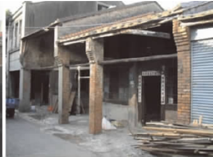
图 2 台湾亭仔脚