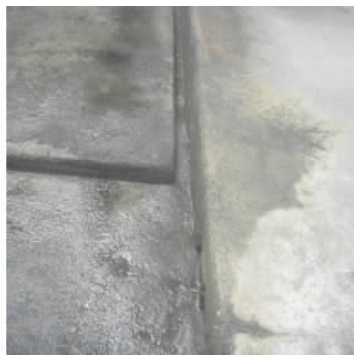
图 6 天井排水明沟