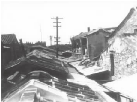
图 3 鹿港“不见天”