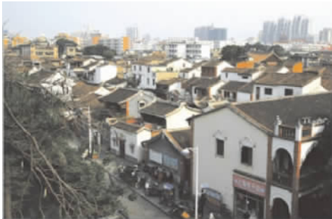
图 1 漳州骑楼