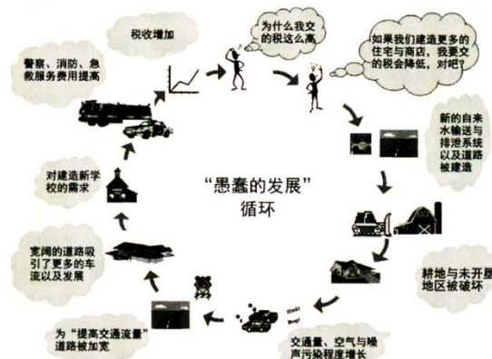
图 2-1 城市蔓延的循环