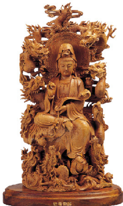
图5 观音 精益木雕商行

当代，仙游较为出名的木雕工艺美术大师有林庆财、林洪英等。林庆财出生于木雕世家，现为中国工艺美术大师。他从小就随父亲林龙藻学习木雕手艺，完全继承了其父的雕刻技艺。他的创作手法不落窠臼、别具一格，作品曾多次在国内外的各项工艺展览中获奖。如木雕作品《万佛梵宫》获得中国工艺美术精品博览会金奖。“这件作品由一块价值百万的沉香木雕刻而成，在山石水木间雕刻了上千尊的佛像，气势恢宏，佛像庄严，不愧为鸿篇巨制。此外，林庆财创作的古代人物如老子、杜甫以及《红楼梦》中的金陵十二钗，脱胎于神佛造像，又有人间生活气息，十二金钗各个特点鲜明”。（图3） ④ 林洪英出生于仙游榜头镇坝下村，其父林金林是老一辈的木雕艺人，她从小耳濡目染，深受家庭环境的影响，12岁时开始学习木雕工艺。她的作品多以历史典故和民间传说为题材。其作品构思新颖，主题突出，雕刻手法细腻，人物造型准确、比例恰当，形神兼备，线条飘逸流畅，给人以动态之美。代表作有《嫦娥奔月》、《十八罗汉》、《关公》等，其中《嫦娥奔月》：“突破了传统的雕法，运用拼雕、浮雕、镂雕等技法将嫦娥、月兔、广寒宫等巧妙融为一体，线条流畅，造型柔美，灵巧飘洒，通过动作、表情和服饰等细部将中国人想要上月的千年梦想主题表现得生动入微、呼之欲出”。（图4） ⑤