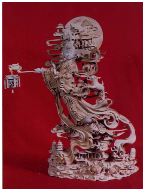
图 4 嫦娥奔月 作者：林洪英

http://www.zjypw.com/news/2009/05/67587.htm , 2009 年 5 月