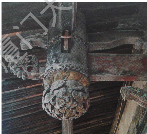
图 1 岐山郑氏大宅院斗拱上斗拱雕刻