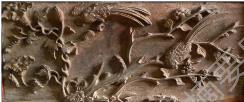
图 6 喜上眉梢

民间流传较广的典故，如桃园三结义、三顾茅庐、岳母刺背以及二十四孝中的卧冰求鲤、哭竹生笋、望云思亲等典故。宗教人物主要有佛教中的佛像、观音、罗