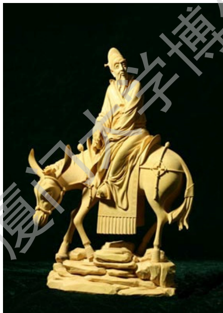
图 3 杜甫 作者：林庆财

的奢靡之风盛行，仙游木雕的样式亦日趋复杂多样。现存于仙游赖店镇岐山村坝头郑氏大宅院，始建于清道光年间（公元 1850 年）。“整座建筑木、石雕装饰点缀其间。其面墙上的八个窗户用不同几何图案的木雕构成，即统一又富于变化。正面大门的两侧都用雕刻有古代人物的木雕图案组成。侧墙上的梁架，包括檐衍、横梁、斗拱、雀替，分别以浮雕、圆雕、透雕等工艺精雕细刻（图 1）”。 ② 此外，仙游县南溪村和郭坂村交界处的红厝瓦陈氏民居，亦有大量精美的木雕作品。“该民居的旧厝部分建于清道光二十二年（公元 1842 年），其大、小厅和大门前屋檐下的梁昂、斗拱、额枋、衍垫板皆刻满花卉、鸟兽、虫草等木雕作品，其中大厅灯梁和大门前檐横梁雕刻极其精细、传神（图 2），大门两边斗拱下面的吊筒，其花卉向纵深精雕细镂，中间空窍相连，故风吹时能听到“呼呼”的响声。而木雕中最让人叹为观止的是绕屋近千米长的随梁枋上面的花卉雕刻”。 ③ 清末民初时，仙游国画大师李霞、李耕的艺术风格对仙游木雕亦产生了深远的影响。