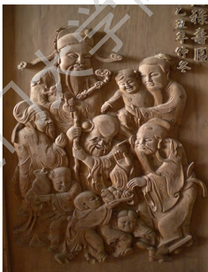
图 8 福禄寿