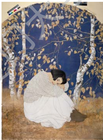
图 2-4 何家英 《秋冥》

如丁绍光的作品，融合西方色彩，运用色彩来表达现代绘画的审美感受，强调色彩的个性，使画面色彩丰富，冷暖对比强烈又相互协调，极具装饰性。人物轮廓用白色描边，使其与背景分离。何家英的作品《秋冥》，悠远而神秘，紫蓝色的天空和金黄色的地面形成强烈对比，在这个背景中，一位凝目沉思的少女，纯真无瑕，塑造了新时期中国女性的审美典范。