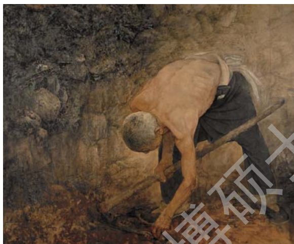
图 2-6 何家英 《山地》

显然，它使当代工笔人物画在反映现实题材上更有艺术的说服力，避免了长期流行在传统人物造型上那种柔弱、概念的模式，使得只适宜画高士、仕女或道释仙佛的传统造型受到颠覆。这是引入写实造型、力度之后当代工笔人物画表现力的突破和提升。