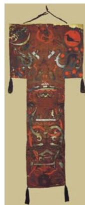
图 1-3 T 形帛画

隋唐五代是一个繁荣昌盛的时代，唐三彩和壁画发展兴盛，工笔人物画也得到了全面的发展。它的题材内容更加广泛，人物画造型写实，重视反映现实生活，风格多样。人物画造型既重视线条的运用，也十分重视色彩对造型的影响。画家们一方面在传统的基础上，学习先代所长；一方面学习外国或其他民族的文化艺术成果。在此期间，出现了阎立本、张萱、周昉、顾闳中等大家，周昉作品《簪花仕女图》，色彩艳而不俗，富于装饰性，视觉感强。而被誉为“百代画圣”的吴道子，则把过去圆润却显得呆板的线描发展成为既有粗细变化又有动感的莼菜