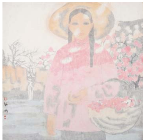
图 2-5 田黎明 《村姑》