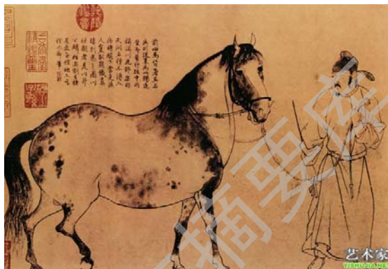
图 1-5 李公麟 《五马图》(局部)

白描画在宋代得到继续发展，并成为中国工笔人物画独立的画种样式。张择端和李公麟都是宋代工笔人物画的杰出代表。李公麟的《五马图》，纯以墨线勾勒，用线简练，通过提按、顿挫、转折等手法，描绘了五马的不同特征和人物的不同风貌，形神兼备。这时人物画的题材范围也更为广泛，造型趋向写真，忠实反映当时的现实生活。如善画儿童生活题材的苏汉臣，还有李嵩的《服田图》、李唐的《采薇图》、陈居中的《文姬归汉图》等，可以看出两宋的人物画有一定的现实生活基础，具有创新精神，尤其是白描画法的大量涌现，将工笔人物画推向了一个新的高峰。