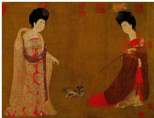
图 1-4 周昉 《簪花仕女图》(局部)

条式的“兰叶描”。他还创作了“只以墨踪为之”的“白画”。 ① 这一时期是工笔人物画发展的一座高峰。