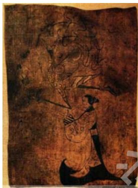
图 1-1 人物龙凤图

唐以前的绘画主要是以线描为表现手段。战国时期的帛画《人物龙凤图》、《御龙图》，主要以墨线勾勒，造型朴实、简约。西汉马王堆出土的 T 形帛画，就有了相当的难度，在画面造型和色彩上都有了很大提高，可以看出其绘画技法方面的自觉。魏晋南北朝时期是中国工笔人物画发展的重要时期，出现了曹不兴、卫协、顾恺之、陆探微、张僧繇等许多名家。其中顾恺之尤为突出，他创造了“高古游丝描”，人物画线描的技法已经发展形成，且较为成熟了。顾恺之在《论画》中提到“...皆摹写要法”， [2] 专谈临摹的知识，可算是最早的工笔人物技法书了。南齐谢赫的“六法”，更是对古代绘画实践的经验总结，可见当时绘画理论的成就之高。