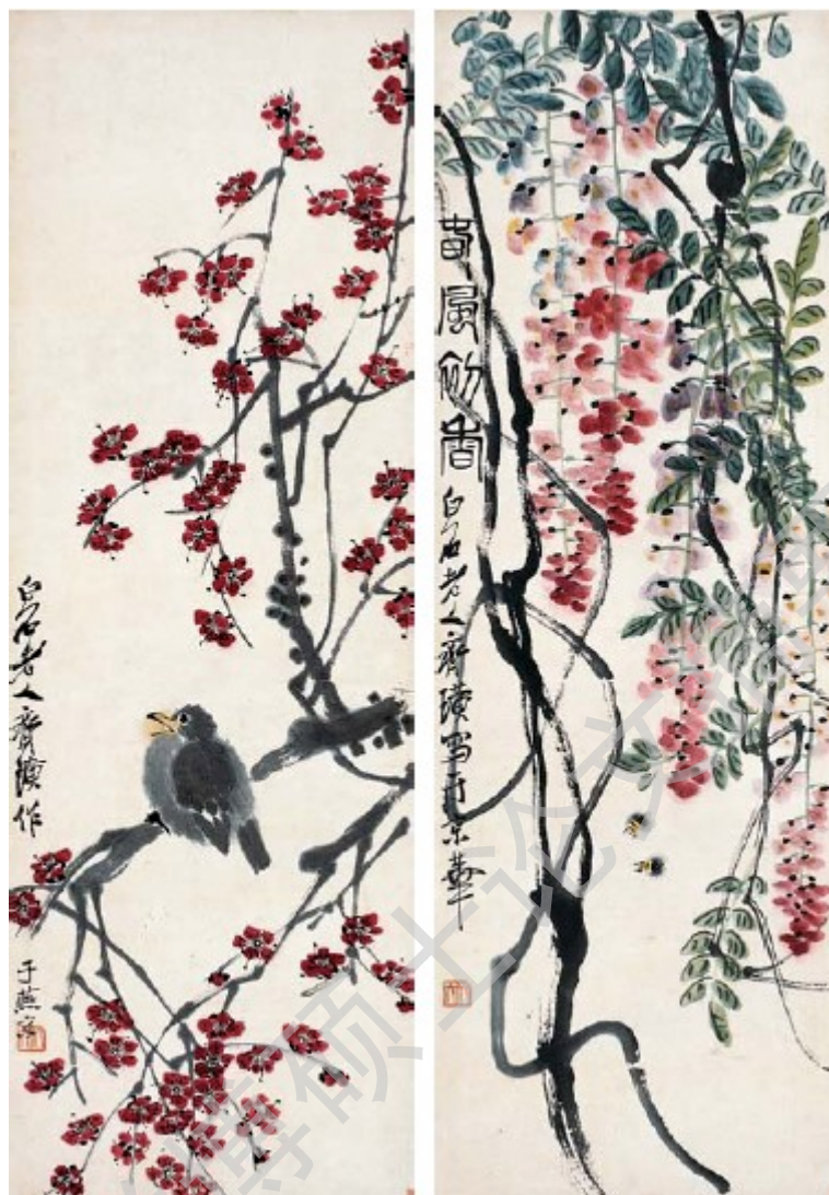
图3: 写意画, 齐白石 (1864-957)

工笔及写意画均讲究线性笔划的运用，因为中国画起源于书法、且与之互相辉映（Wong, 1991）。与西方画家不同，中国画作者创作时往往一气呵成，不加修改，传递一种自信与豪放，是作者对物象表达的自然流露。