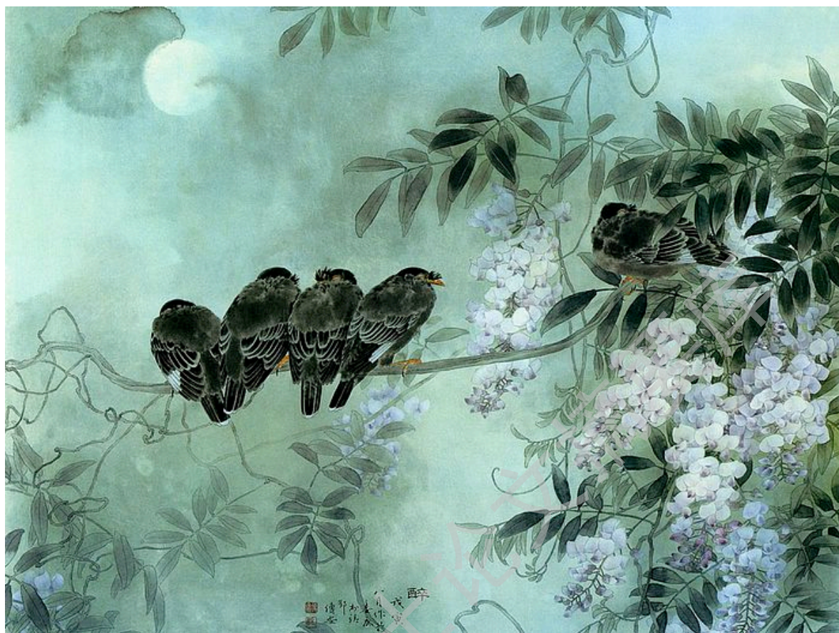
图2: 工笔画法, 邹传安 (1941-)