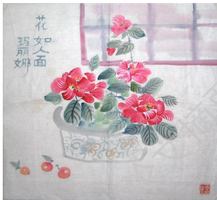
图4: 我的早期写意作品——花如人面

在研习中国画初期，我学过书法和水墨风格的花鸟画，以提升运笔能力。绘画运笔，水墨平衡，需要大量练习才能掌握。以下是我研习早期的部分画作。