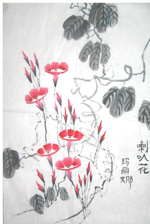
图 5: 我的早期写意模仿作