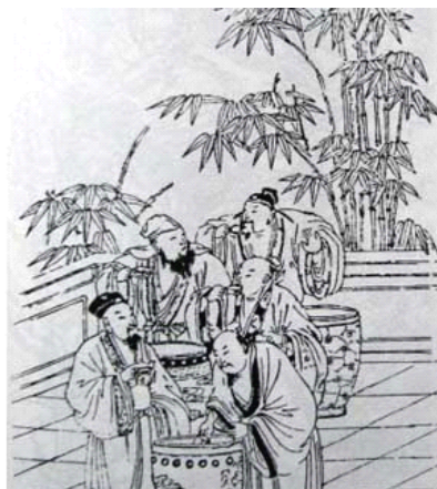
图 2-5 用“三纲五常”的吉祥图画来寓意做人要有德行和规范

吉祥文化与儒家思想有着密切的联系。相传孔子在出生前，就有麒麟前来报信的故事，后来人们用一童子跨在麒麟上的图画来表现“麒麟送子”这一吉祥寓意。儒家提倡的“三纲五常”思想也常用吉祥的图案形式来表现，如吉祥图《三纲五常》中有三口大缸，五个人围在缸边尝酒，“缸”谐音“纲”，“尝”谐音为“常”，寓意做人要有德行、礼仪和规范（图2-5），由于寄予了某种吉祥美好的寓意，它们后来都成为经典的表达吉祥美好心愿的图式；此外，儒家强调“修身”作为治国平天下的入世思想，所以孔子的“岁寒，知松柏之后凋也”的文句，后来就演变为被喻为“岁寒三友”的、以“松竹梅”三种植物作为传递吉祥文化理念的图案表达，它更被中国古代的文人雅士作为高洁情操的礼赞和自我修身的衡量标准，即使在今天，松竹梅也作为