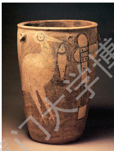
图 2-3 仰韶文化中的彩陶缸绘鸛鱼石斧纹

资料来源：洪再新. 中国美术史图像手册 [M]. 杭州：中国美术学院出版社，2003.