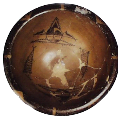
图 2-4 出土于西安半坡的人面鱼纹陶盆