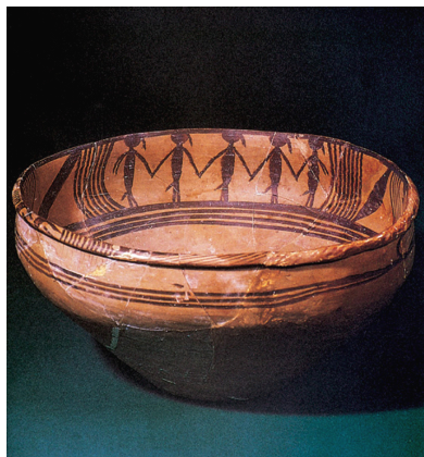
图 2-1 属马家窑文化的舞蹈人纹彩陶盆

（陶盆内壁绘有三组舞蹈图，每组均五人，是先人庆祝丰收或祭祀祖先的场景，反映了人们对美好生活的向往）