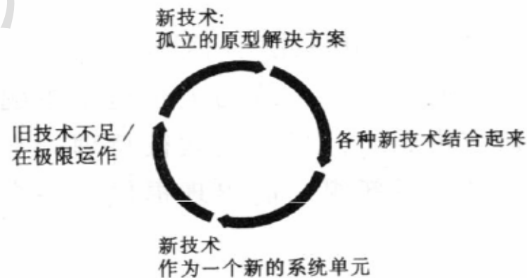
图 2：媒介进化的技术周期图 ①