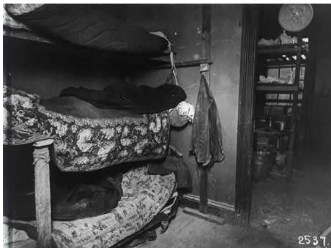
图 3. 1890 年纽约公寓楼内部 ①

在贫民窟内，人口过度拥挤，房屋建设简陋，“完全违背了排水设备、管道装设、照明、通风、防火或意外事故等安全设施的所有规定；挤得水泄不通的房屋又脏又暗；导致他们的食物易于腐烂；很多贫民窟集中区既缺少排水系统，又无污物处理设施，巷口和露天阴沟常遍布垃圾和污水，厕所均令人作呕，空气中也弥漫着腐败的气味” ② 。当时，一位美国《太阳报》的年轻记者雅各布·里斯深入纽约市贫民窟进行实地考察，收集了大量第一手资料，写出《那一半人怎样生活？》一书，真实地披露了贫民窟居民的悲惨处境，在社会上引起强烈的反响。他在书中写道：“这些楼层的全部新鲜空气都是从那扇永远乒乓作响的过道门和那些黑洞洞的卧室窗户透过来的……过道里到处都是污水坑，所有的住户都由此出入，因而在炎夏之际也都要忍受这些臭气熏天的污水坑的毒害……几堵阴暗的砖墙之间的间隙是（所谓的）院子，那上边有一狭长的烟尘弥漫的天空才是这里居民所能望到的苍天。” ③ 然而就是从这些改建或新建的如此简陋的住房中，房地产商人仍攫取了惊人的利润。他们所索取的房租几乎都是敲诈性的，一般房租的年利润均相当于该房产总值的 10%至 12%，有的甚至高达 40%。而且，破旧的房屋也不予以及时修缮，房主对那些无力支付或不愿预付房租的住户不是进行起诉，就是加以驱逐。 ④ 在贫民窟集中区，卫生设施极不完备，很多城市垃圾无法处理，只得就地掩埋，或倾倒在露天阴沟。这些垃圾传播疾病自不待说，还因堆