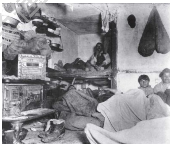
图1. 1889年意大利移民拥挤在纽约一间“寄宿住房”内。 ②

国私有制已经成熟，土地被看作为最主要的私人财产。政府的基本职能是保护私人财产，包括私人拥有的土地，因此政府对土地的使用不加干预，城市开发活动几乎完全在私人手里，其后果是房地产商人趁机大肆进行投机活动，从中牟取暴利。他们或者把所占有的地皮划成小块待价而沽，或者兴建简陋住宅，而地价飞涨，房租提高，促使那些“惟利是图的房主”为了获取更高的利润，一再分割本已十分狭小的房间，“用尽各种手段，尽其所能地把最多的人口塞进最小的空间里”，因此，“从地下室到阁楼，从门厅到盥洗室，在所有可资利用的地方”，都立即住满了房客。即使如此，还是不能满足人们对住宅的需求。当时，一种十分简易的“寄宿住房”（boarding house）一时兴盛起来。据沃尔特·惠特曼于1856年的估计，纽约大概有7/10的住宅为寄宿住房，即使那些社会的中上阶层，也有3/4生活在寄宿住房中。在大城市里，客户们要立即找到“私有、体面、经济”的住宅几乎是不可能的。当时的一位作家写道：“就像死亡一样，没有哪一个阶层能够逃避……这种如此普遍的陋屋。” ① 虽然许多社会工作者和慈善家不断努力改善城市住宅条件，但他们不得不在一次又一次移民浪潮和房荒的冲击下节节败退。