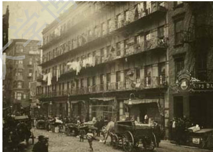
图 2. 1890 年，纽约的公寓楼 ⑤

沃特大街 (water street)。但普遍盛行起来则是在 19 世纪后期，到 1867 年纽约已建造了 1.8 万套经济公寓。 ① 其他许多大城市的内城居民区也同样密密麻麻地布满了这种丑陋的建筑，纽约市的经济公寓最富有代表性，其标准设计为宽 25 英尺、长 100 英尺、高 4—6 层，每层分 4 套住宅，每座公寓楼之间只有 10 英尺之隔。这种经济公寓房间狭小，有些公寓一层楼最多有 16 间房间，却仅仅有四扇窗户，通风不良，空气污浊，光线暗淡，甚至终年不见阳光。另外，室内设备极其简陋，没有下水道、厕所和取暖设备，户外公用厕所肮脏污秽，臭气熏天。这种糟糕的居住环境严重影响着租户的身心健康，数以千计的人曾经死于在这种环境中极易传播的肺结核、天花、霍乱等传染性疾病，一旦发生火灾，租户往往由于缺乏应急出口而丧生。就是这样简陋狭小的住宅，也常常要几家分享，或者接纳寄宿房客，以节省租金。1890 年，美国平均每套住宅居住 5.45 人，而纽约市却高达 18.52 人。 ② 纽约市的人口密度远高于全国其他地区。1879 年，纽约市的贫民窟住宅即已有 2.1 万个，至 1900 年更增至 4.3 万个，容纳居民高达 150 万，而当时整个纽约市人口尚不足 400 万。 ③ 这些贫民窟里居住着爱尔兰移民和山羊，沿着东区延伸达 60 多个街区。 ④