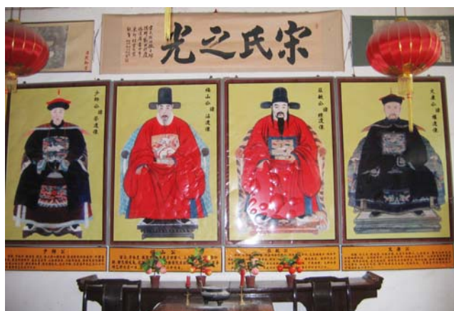
商丘宋氏祠堂内的乡贤名宦