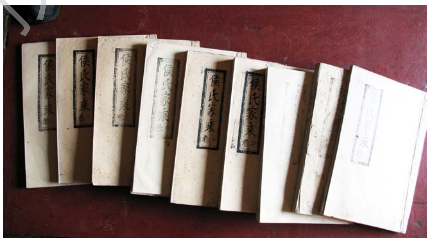
商丘侯氏家乘（清光绪 30 年本，军户家族）