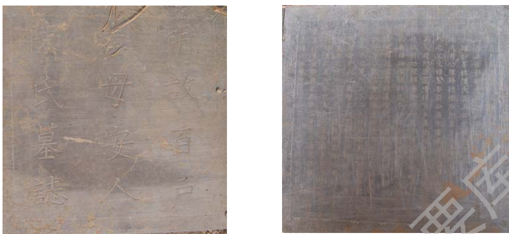
明故百户秦母安人陈氏墓志（明嘉靖 3 年）