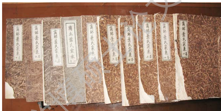
商丘叶氏家乘（民国 8 年本，卫官家族）