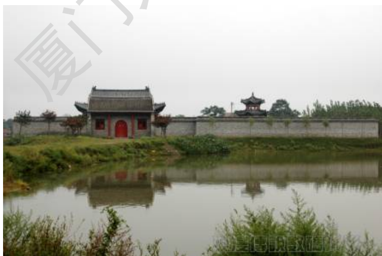
商丘文雅台：文雅社所在地