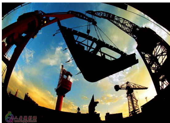
图 1-5：繁忙的城市建设