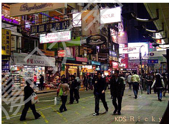
图 1-1：香港铜锣湾夜景

随着经济的发展和社会的进步，城市公共空间的品质越来越为人们所重视。商业街区作为城市公共空间的一个重要组成部分，是市民们进行购物、休闲、娱乐与交流等诸多城市公共生活与社会活动的场所，是城市得以存在和发展的重要支撑平台，也是城市的精华所在。商业街区在集聚城市人气、发展城市经济与展现城市面貌等诸多方面都起着十分显著的作用，对于一座城市乃至一个区域的发展也具有相当重要的意义。在某种程度上可以认为，一个城市的商业街区是否优秀、是否充满活力反映了这个城市是否优秀、有否充满活力。许多著名的城市商业街区，如香港的旺角与铜锣湾、台北的西门町与信义计划区、北京的王府井与三里屯、上海的南京路与新天地，都成为其所在城市的地标与城市魅力的象征(图 1-1、1-2)。