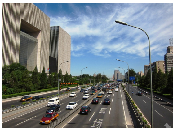
图 1-3：汽车日渐成为街道的主角

与代表（图 1-3）。汽车成了建构与影响城市空间的重要因素甚至日渐成为街道的主角，这就从一定程度上削弱了城市商业街区作为市民公共生活与社会交往平台的角色，进而抑制了本应丰富多彩的城市生活。而一些城市商业街区由于在交通组织、空间环境、经营管理等方面不恰当的处理，更致使其人气低落、缺乏活力，无法起到其作为城市重要元素所应发挥的作用，给整个城市健康、可持续发展带来了不良的影响（图 1-4）。