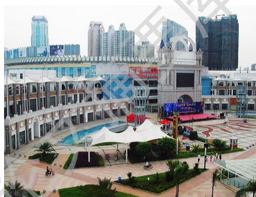
图 1-6：被两条城市主干道所隔的明发广场 图 1-7：人气不足的明发商业广场