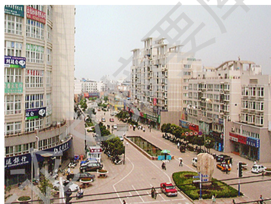
图 1-4：缺乏人气的某城市商业街区