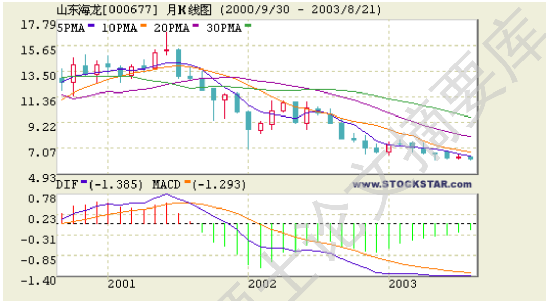
图 1-3 2000-2003 年山东海龙股价走势图

资料来源：证券之星 www.stockstar.com, 2003 年 8 月 22 日