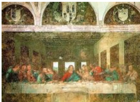
图(7)《最后的晚餐》达·芬奇 421cm×903cm 布面油画 1499年

光照下所产生的色彩变化，即蓝天、白云、绿草……而随着自然科学的发展，我们对色彩也有了新的认识，明白了大自然之所以五彩缤纷，不仅仅是因为物体本身的固有色，还因为不同物体拥有不同的吸收和反射光波能