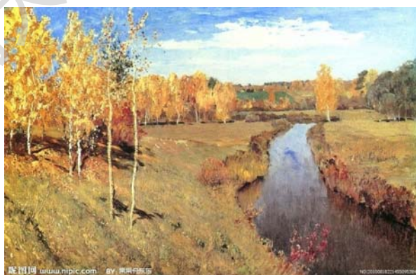
图(8)《金色的秋天》列维坦 82cm×126cm 布面油画 1895作

当我们细心体会大自然,天空越高,空气越薄越透明,天空越低,灰尘及杂物越多就越厚越不透明。高原与平原的空气透明度很明显也是不同的,比如拉萨与北京。辽阔的原野与窄小的室内空气清新度是不同的,比