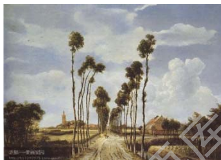
图 (4) 《林间小路》 霍贝玛

明) 这种画法可以营造出深远的画面空间，从这种科学方法的运用来看，《林间小路》是相当成功的，但整体上看并没有脱离中世纪时期画坛上的“酱油色调”。那么这就意味着在风景油画中，专注于空间的表现、只有透视科学是不够的，还要运用丰富的色彩，它包含着明暗、冷暖、纯度,也包含着画家的主观感知和情绪,这样风景油画才能更加感人。