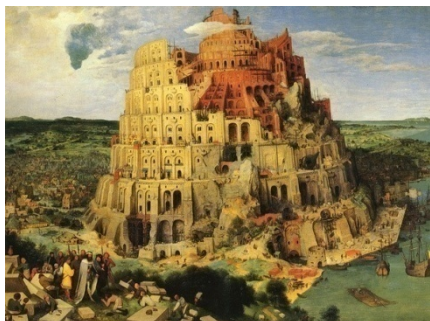
图 (3) 《通天塔》 勃鲁盖尔

到了 17 世纪，荷兰画家霍贝玛(Hobbema, Meindert, 1638~1709)，代表作《林间小路》，运用了典型的焦点透视法，十分准确。（这种方法是由 15 世纪正值文艺复兴时期的意大利佛罗伦萨著名建筑师布鲁内莱斯（Brunelleschi）所发