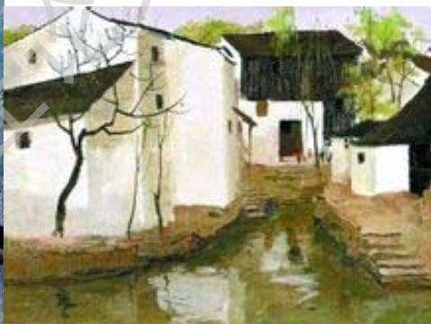
图（6）《江南水乡》吴冠中