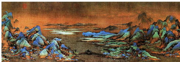
《千里江山图》 北宋 王希孟