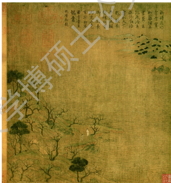
《游春图》隋代 展子虔