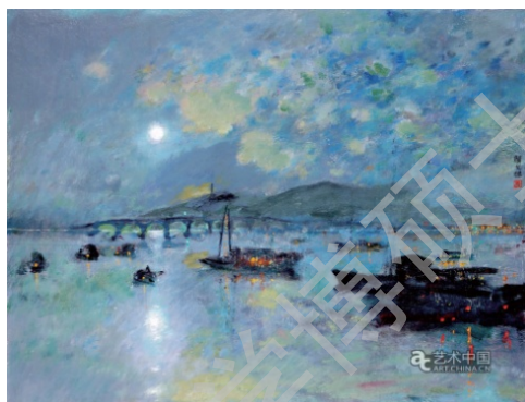
图（5）《石湖串月》颜文梁