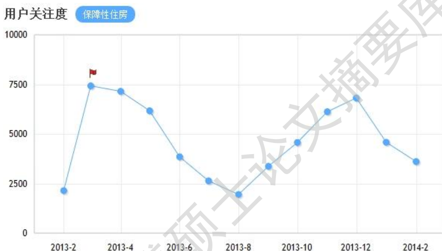
图 2 社会保障性住房研究领域近一年用户关注度分析 ②

政策”作为关键词搜索则有大约 15554 条期刊文献记录和 5050 条硕博论文记录 ① 。通过对目前国内文献的梳理发现，大多数学者将研究目光放在宏观领域的保障性住房政策目的、实施与改进方式等方面，以及对国外其他国家社会保障性住房政策的介绍与分析等领域，对国内某一具体地点社会保障性住房政策的评价分析相对较少。同时，从下图 2 的用户关注度分析图可以看出，在过去一年时间里，保障性住房领域的研究在学术群体内的关注度始终保持较高的水平。