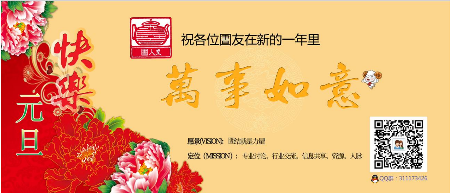
图4 團人堂2015年新年贺卡