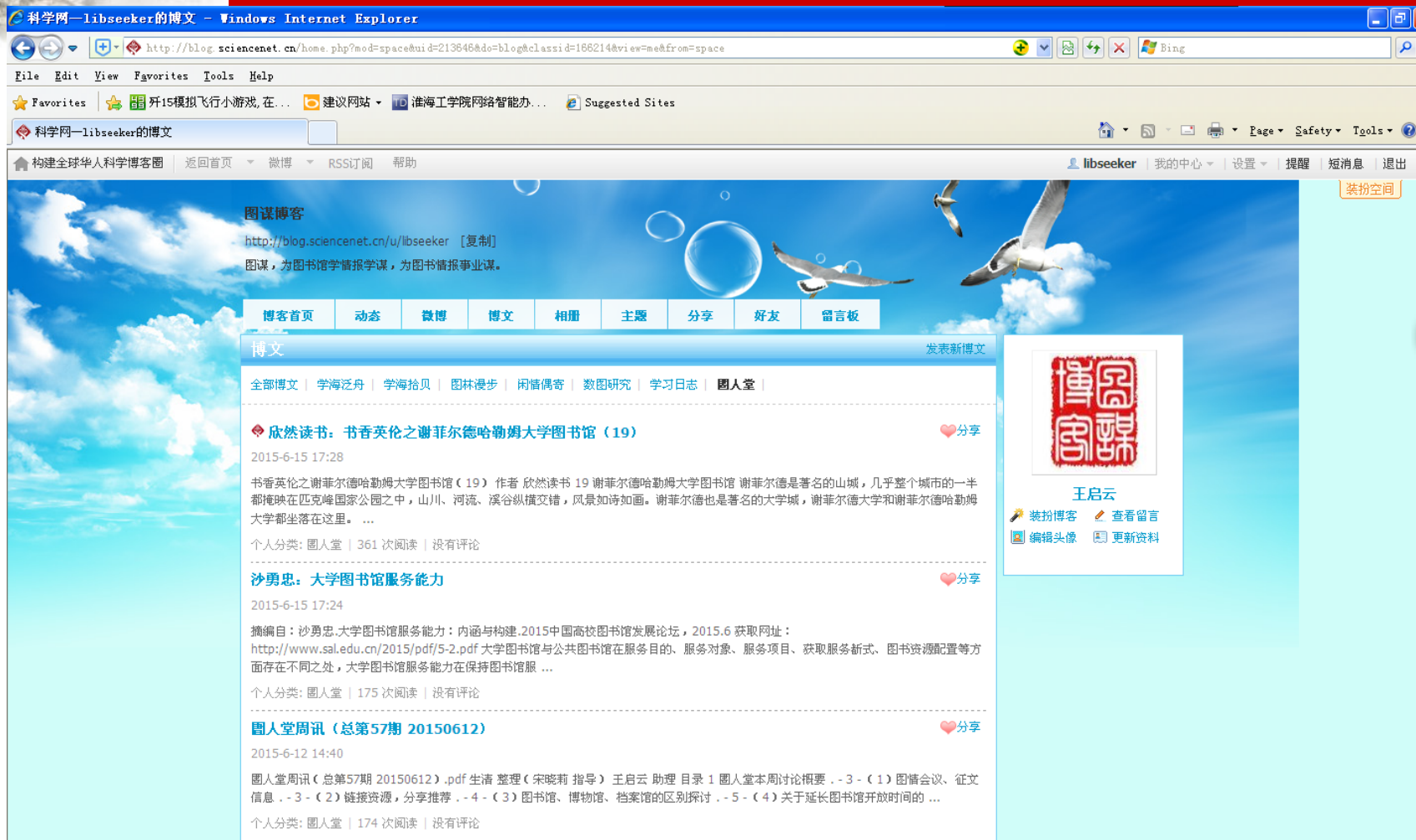
图3 科学网围人堂专题