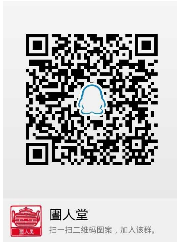
图5 團人堂加群二维码