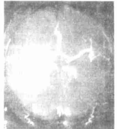
图 3 合并其它小脑梗死者 MRA 示椎-基底动脉未显影