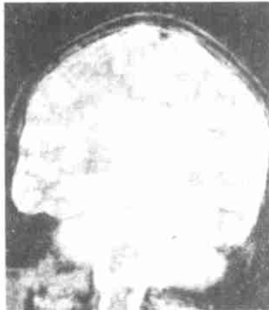
图 2 双桥臂梗死灶