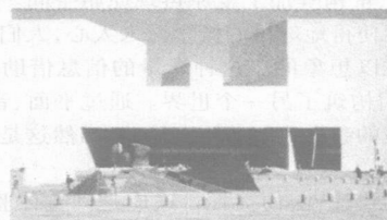
图1 美国国家美术馆东馆

体现这个原则最典型的例子就是他在美国华盛顿设计的美术馆东馆(见图1)。华盛顿国家美术馆西馆是新古典主义风格的建筑,东馆的基地位于面对美国国会大楼的一块锐角三角形的狭长地带。这个项目有极大的挑战性,它必须考虑与新古典主义的西馆相配合和折衷主义的国会建筑相协调,必须与整个广场中各种类型的、建于不同时期的建筑建立协调关系,还必须契合那条三角形狭长地带。贝聿铭充分考虑了这些环境和文化历史因素,巧妙地采用一个等腰三角形和直角三角形组成东馆的基本结构,其中等腰三角形是展览区,直角三角形是研究区,使用外表墙面相同的大理石材料,与西馆甚至与广场中间的华盛顿纪念碑保持关系,为了进一步协调近在咫尺的旧馆,他在新馆的设计上采用了和旧馆相同的檐口高度,在内部他采用了惯用的中庭大天窗顶棚和三角形符号,强调建筑的形式特征,宽敞的内部空间,具有强烈的现代主义特色。