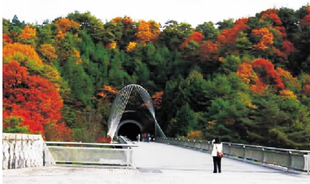
图1 美秀博物馆入口广场

京都府立陶板名画庭展示部分延续了安藤忠雄一贯的矛盾与共生的建筑理念(图3),用简单的几何体营造了空间的多重交错,并且与周边大自然保持似断非断、欲语还休的内在联系。安藤说过:“由等跨的框架结构营造的均质空间是现代建筑的首要基础,而我则倾向于创造一种看似简单而实际上远不