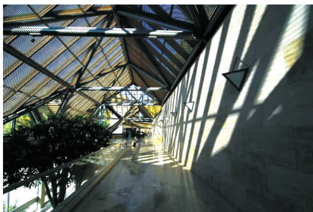
图5 美秀博物馆光与影