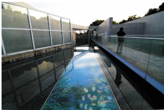
图6 陶板名画庭水池