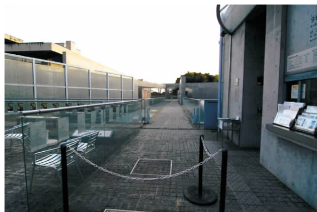
图2 京都府立陶板名画庭入口