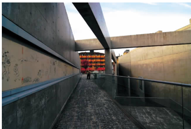
图4 陶板名画庭展示空间