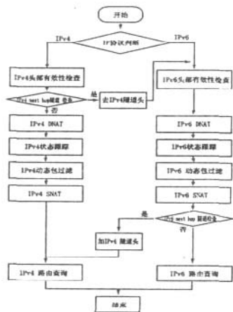
图3 嵌入式 IPv6 防火墙功能模块控制流程

的时候,会流经后三个模块,然后进行 IPv6 路由查询之后被发送到外网。内网发出的包经过 IPv6 状态跟踪记录或更新连接状态,进行动态包过滤,在发出之前做 SNAT(源地址转换)处理,将源 IP 通常是内部 IP,对外网无效)转换成防火墙的对外公共 IP。