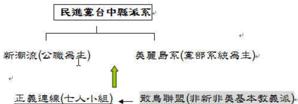
圖三 台中縣民進黨派系現況

新系與美系對立由來已久，美系人士抱怨新系擁抱敵人(拉攏紅黑個別勢力)，打壓自己人(民進黨)；台中縣新潮流系拿下多席立委席次及縣長寶座，形成了黨部與公職分屬兩派系，號令難以施行貫徹。在弱美系強新系的情形下，未來民進黨在台中縣新潮流為主的局面，不致有太大變化。至於正義連線，除了以不分區立委形式進軍台中縣，以劉坤鰲為首組成七人小組，企圖在台中縣打下一片江山。正義連線號稱是陳水扁總統的嫡系，然而並未帶進資源，反而是吸收與瓜分派系資源 33 。見縫插針，讓地方上民進黨派系主流不敢輕忽。