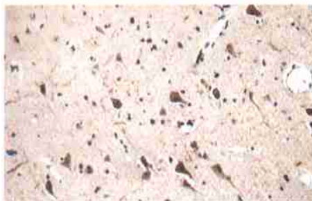
图2 正常脑组织中,Axin在神经元表达阳性而神经胶质细胞表达阴性(SABC, ×400)

正常脑组织中神经元胞浆表达阳性,神经胶质细胞表达阴性;8例(28.6%)胶质瘤组织中瘤细胞Axin胞浆表达阳性,其中II级1例,II~III级2例,III级2例,IV级3例,检测到突变的样本中有1例Axin表达阳性。(图2,3)