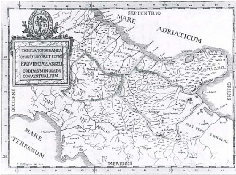
Provincia di Sant'Angelo - Tabula Topographica di Francesco Antonio Righini, Provinciale Ordinis Fratrum Minorum... , Romae, ex typographia Joannis Zempel, 1765.