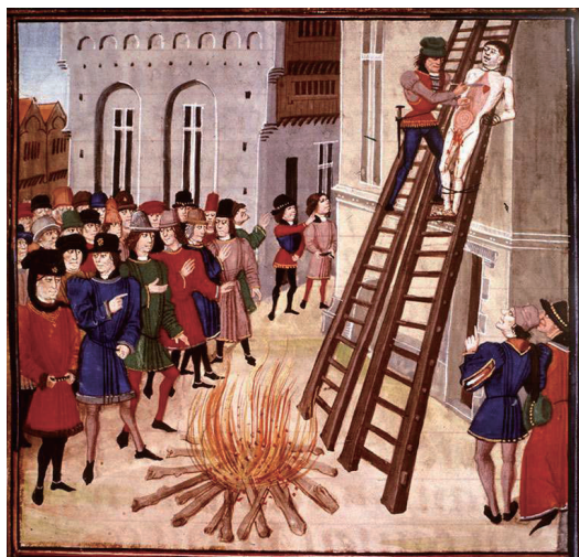
エドワード2世の寵臣、Hugh le Despenser 貴族勢力の憎しみを買い、惨殺される (1326) 2