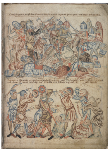
バノックバーン (Bannockburn) の戦い (1314) ロバート1世率いるスコットランド軍、エドワード2世率いるイングランド軍に大勝する。イングランド軍の損害15,000名以上 3