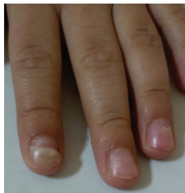
Рис. 5. Онихомадезис на пальцах левой кисти (через месяц после выписки из стационара)

Синдром «рука-нога-рот» — типичная форма энтеровирусной экзантемы, периодически напоминающая о себе эпидемическими вспышками и иногда возникновением тяжелых осложнений [4]. На территории нашего региона повышение заболеваемости ЭВИ совпадает с летними (июль —