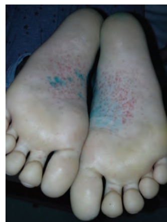
Рис. 3. Геморрагические высыпания на стопах (12-е сутки болезни)