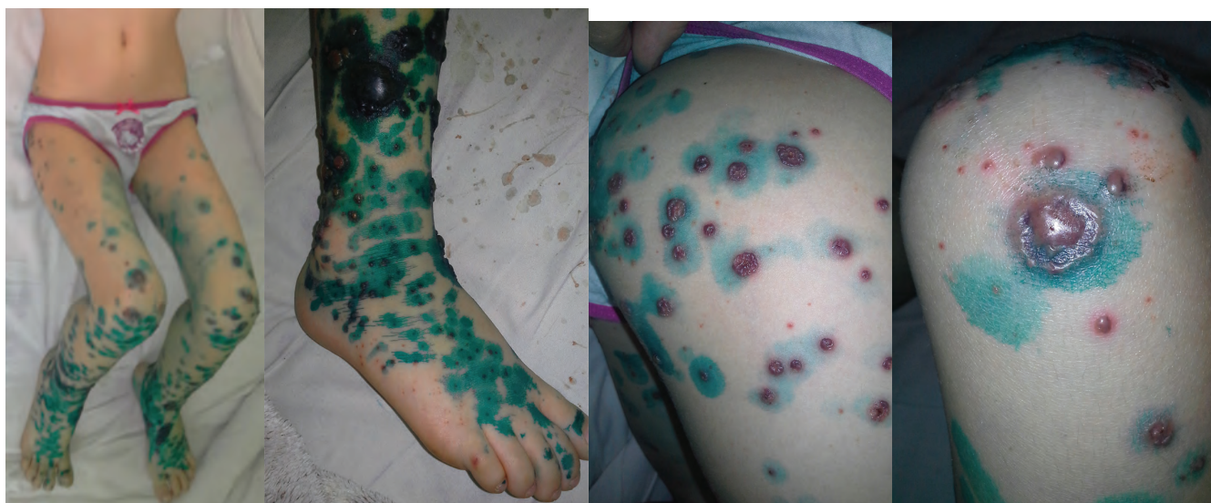
Рис. 1. Локализация высыпаний в день госпитализации (6-е сутки болезни)

При поступлении на стационарное лечение общее состояние девочки средней тяжести за счет кожного и интоксикационного синдромов. Положение в кровати вынужденное: на спине с полусогнутыми ногами. Кожа бледно-розовая с множественной полиморфной, папулезно-везикулезно-буллезной экзантемой размером от 0,4 до 6,0 см в диаметре, с серозно-геморрагическим содержимым ее полостных элементов, которые локализовались на неизменном фоне кожи. Более обильной сыпь была на коленях, голенях, тыле обеих стоп, ягодицах. Единичные пятнисто-папулезные высыпания обнаружены на правой ушной раковине и обоих локтях. Остальная поверхность кожи (голова, шея, туловище) чистая (рис. 1). Слизистая конъюнктив гиперемирована. Двусторонний ангулярный хейлит, больше справа. Язык влажный с белыми паутинными налетами вдоль центральной оси, ближе к правому краю выявлена округлая болезненная афта 0,3×0,6 см (см. рис. 2). Мягкое небо и задняя стенка глотки не изменены, миндалины рельефные, без налетов, выступают за пределы дужек и на ¼ перекрывают зев (см. рис. 2). Пальпируются подчелюстные, передние шейные, паховые лимфоузлы: мелкие, размерами 0,5×0,7 см, не спаянные между собой и с окружающими тканями, эластичные, подвижные, безболезненные.