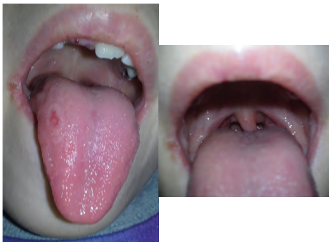
Рис. 2. Единичный элемент на языке и хейлит в день госпитализации (6-е сутки болезни)

Менингеальные симптомы отрицательные. Физикальные данные со стороны сердца, легких и живота соответствуют возрасту. Мочеиспускание регулярное, суточный диурез в норме. На момент поступления под наблюдение испражнений не было в течение 3 суток.