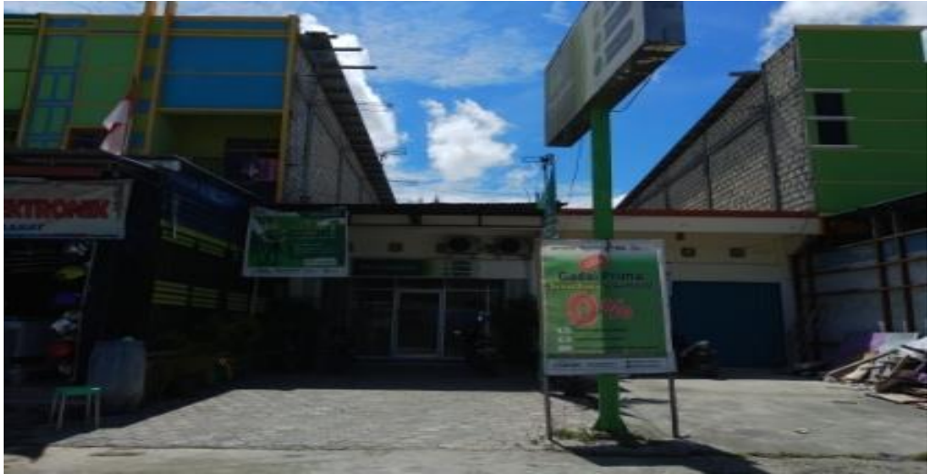
Gambar 4. Gedung Perkantoran dan Pertokoan Di Sepanjang Jalan Poros