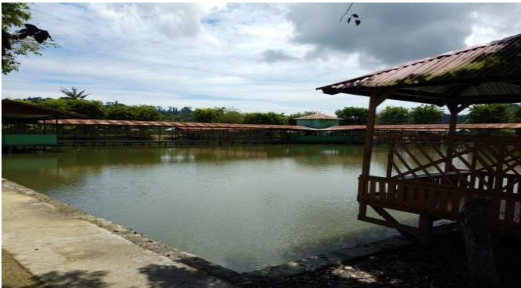
Gambar 2. Kolam Pemancingan Yudistia Koya Barat

membeli lahan kaplingan yang awalnya merupakan lahan pertanian, kemudian dibeli oleh investor dan selanjutnya dipecah menjadi kaplingan-kaplingan berukuran kecil, untuk dijadikan rumah tinggal bagi masyarakat yang membutuhkan. Maraknya pembangunan perumahan di Koya Barat dan Koya Timur merupakan salah satu kebutuhan mendesak yang dilakukan akibat ledakan penduduk yang berada di pusat Kota Jayapura, kebutuhan perumahan baik secara pribadi, karyawan swasta maupun kebutuhan perumahan bagi PNS sudah merambah ke wilayah tersebut, dimana wilayah jantung Kota Jayapura dan kota Distrik sekitarnya sudah tidak mampu melakukan pengembangan perumahan akibat lahan yang terbatas. Semakin padatnya penduduk Kota Jayapura, maka perluasan Kota Jayapura mengarah wilayah Koya yang merupakan pinggiran Kota Jayapura yang cukup luas. Menurut data BPS Kota Jayapura (2019), wilayah tersebut mencapai 9.247.107Ha untuk Koya Timur dan 3.885.019Ha untuk Koya Barat, sedangkan yang diberikan kepada transmigran secara keseluruhan seluas 5.200Ha, untuk tempat tinggal dan bertanam padi agar Kota Jayapura mampu berswasembada padi. Namun tanaman tersebut sudah tinggal sebagian kecil saja, \pm 150Ha, dimana selebihnya telah berubah menjadi kolam pemancingan, perkebunan, pertokoan, perumahan serta kantor-kantor baik pemerintah maupun swasta dan juga dibangun berbagai fasilitas umum lainnya yang digunakan untuk kepentingan masyarakat.