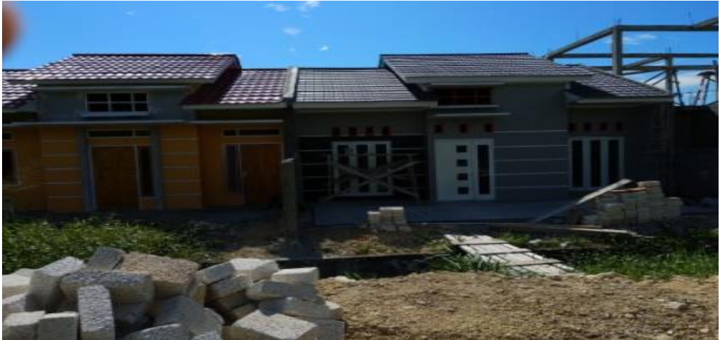
Gambar 5. Pembangunan BTN Di Jl. Abepura Koya Barat