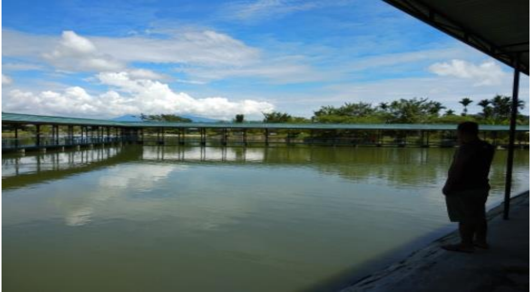
Gambar 3 Kolam Pemancingan Aji Kencana Koya Timur