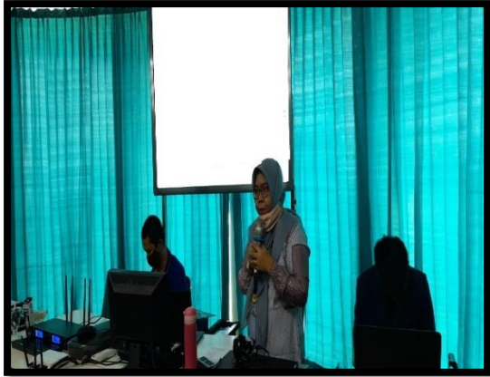
Gambar 2. Pemaparan Materi oleh Tim Pelaksana Kegiatan Pengabdian Kepada Masyarakat