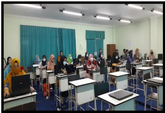
Gambar 3. Peserta Kegiatan Pengabdian Kepada Masyarakat