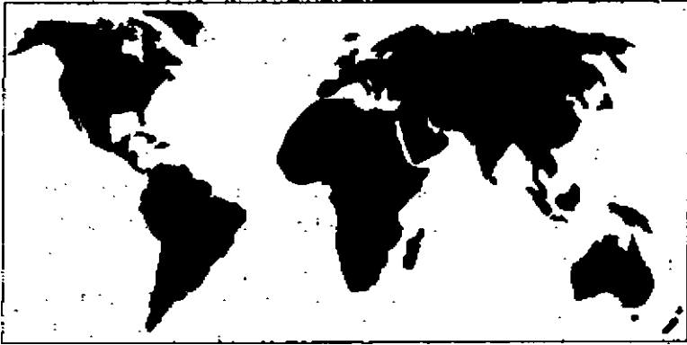
Harita 1. Dünyada Karaların ve Suların Dağılımı

Sularla kaplı sahaların % 97.5'ini tatlı olmayan su kütleleri oluşturur. Okyanuslar, denizler ve göller gibi. Geri kalan % 2.5'lik saha tatlı sulardan oluşur (Şekil 1). Tatlı su yeryüzündeki canlı hayatın devamı için çok önemli bir kaynaktır. Çünkü susuz hayat düşünülemez. O halde tatlı suların toplam alanı ne kadardır?