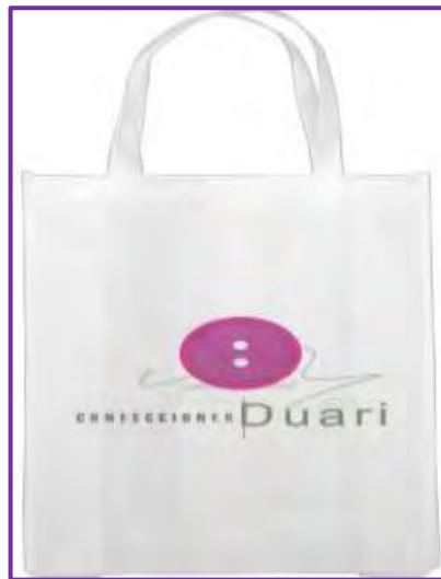
Figura 7 Diseño de Empaque

Estrategias de Promoción. Se recomendó a la empresaria rediseñar las tarjetas de presentación de igual manera actualizar la información.