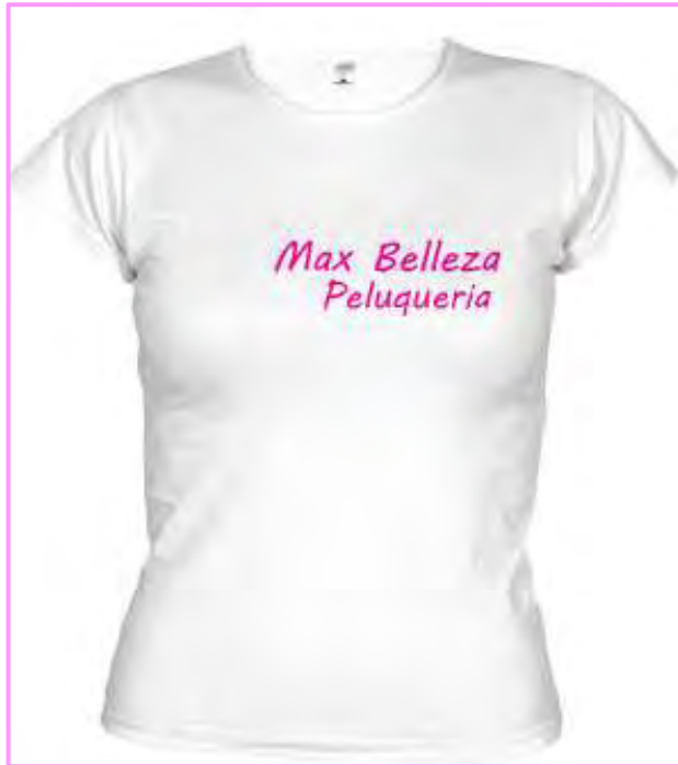
Figura 13 Estrategia de personal