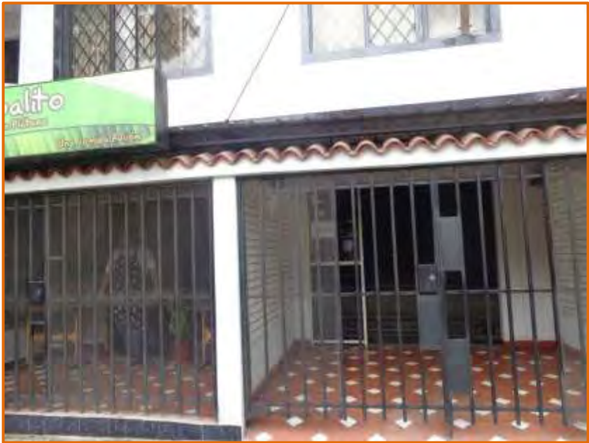
Figura 12. Lugar previsto para la ubicación del negocio

El anterior cuadro, hace referencia a todo el estudio de inversión que se realizó para la implementación de un negocio de comidas rápidas en el barrio Ciudad Córdoba.