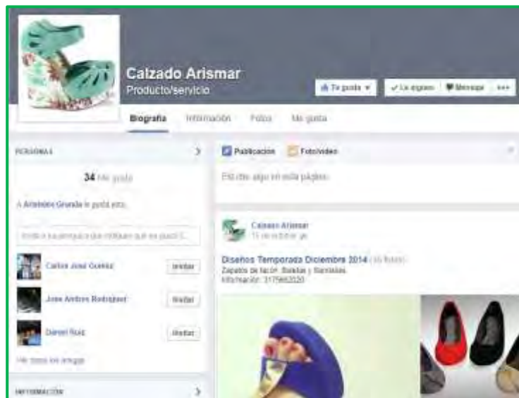
Figura 4 Diseño de FanPage

Esta fue una de las estrategias que tuvo más impacto para la marca. La elaboración de la Fan Page fue una estrategia de medios digitales para llegarle de una manera más efectiva al mercado objetivo. La respuesta fue positiva debido a los comentarios realizados en las fotos de los zapatos de igual manera por la llamada de una persona de otra ciudad que deseaba más información del producto.