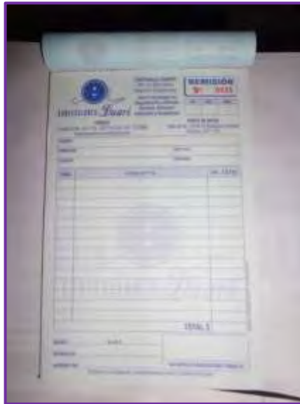
Figura 9 Diseño de Factureros

Estrategias de Plaza. Confecciones Duari se encuentra ubicada en el barrio El Retiro, su planta de producción queda en el segundo piso de la casa de la señora Esperanza Duarte dueña de la empresa.