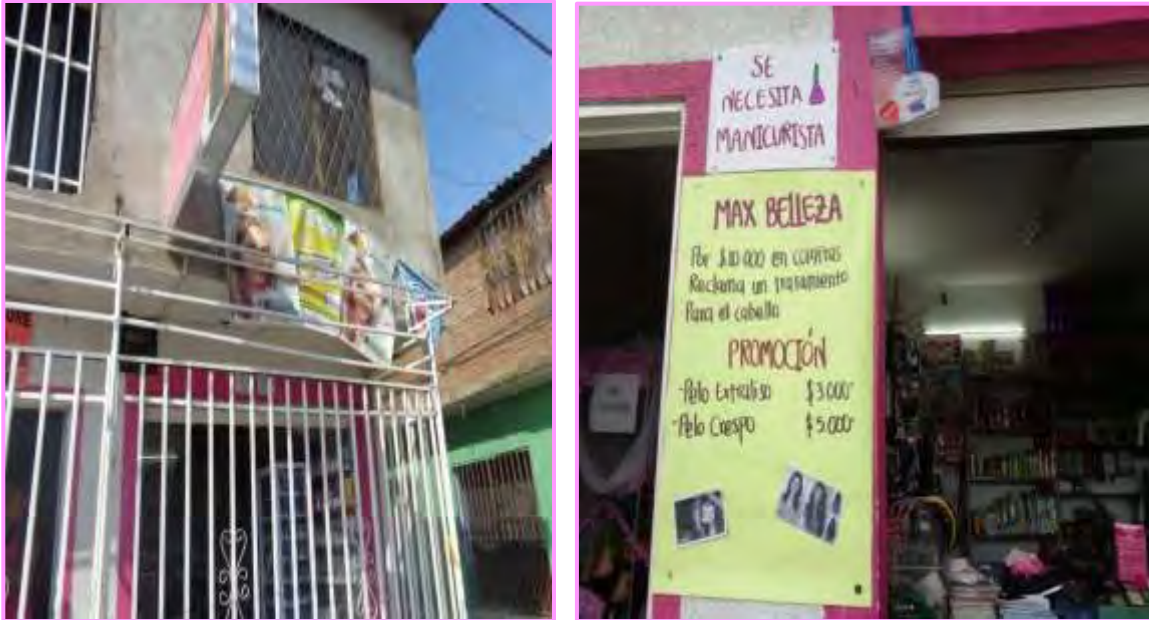
Figura 11 Estrategia de Producto