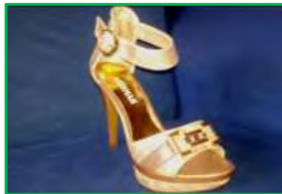
Figura 2 Producto Calzado Arismar