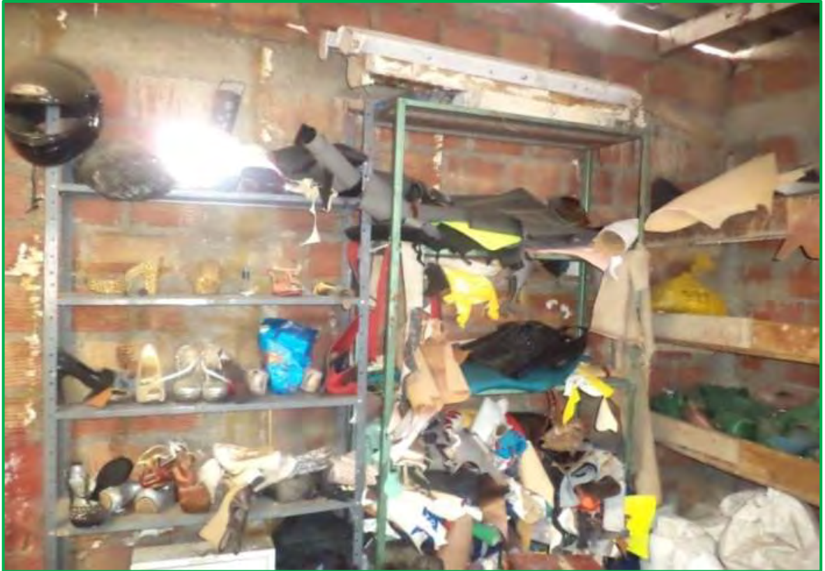
Figura 6 Planta de Producción