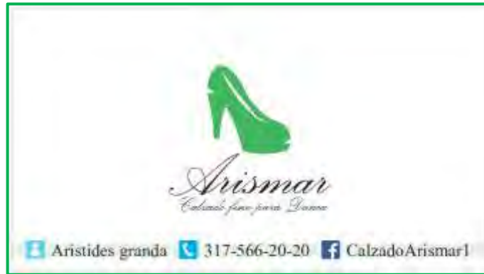
Figura 3 Diseño de tarjetas de presentación

el empresario escogió la que se muestra a continuación con el diseño de las tarjetas de presentación.