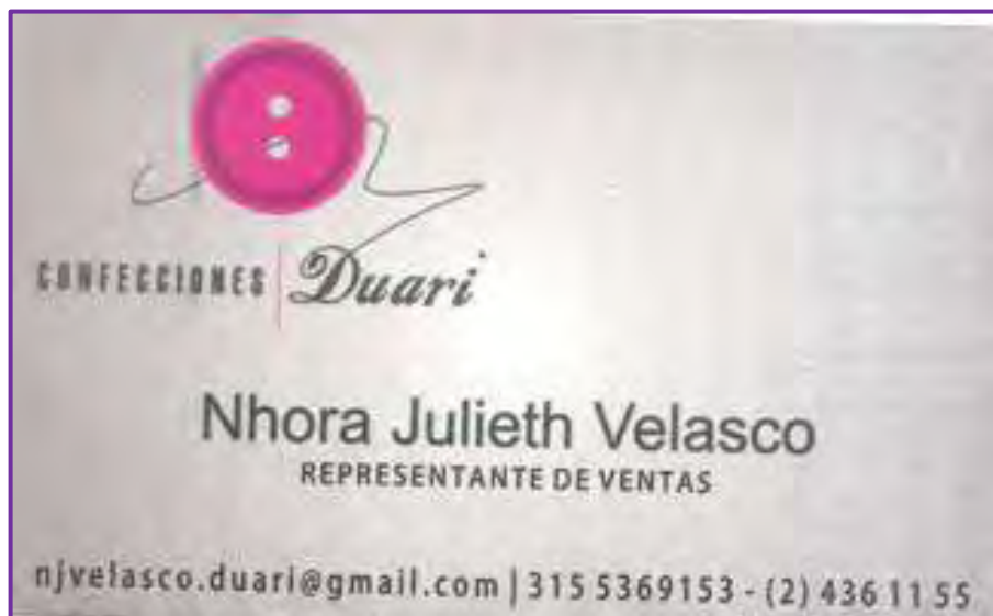
Figura 8 Diseño tarjetas de presentación

Estrategias de Promoción. Se recomendó a la empresaria rediseñar las tarjetas de presentación de igual manera actualizar la información.