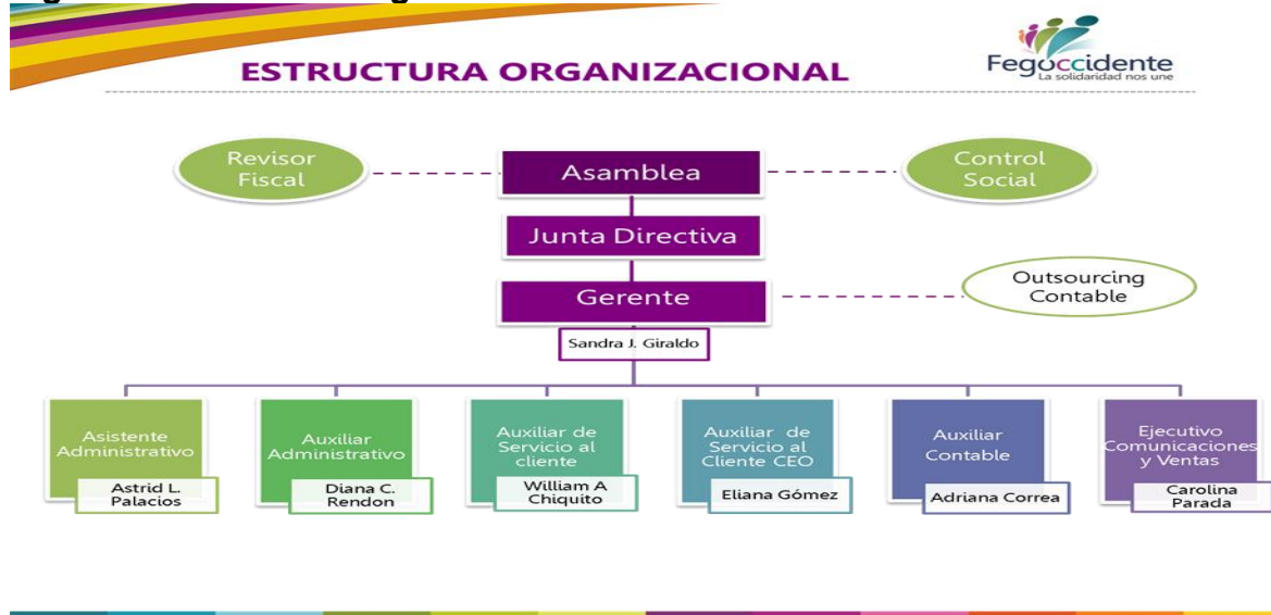
Figura 2. Estructura Organizacional