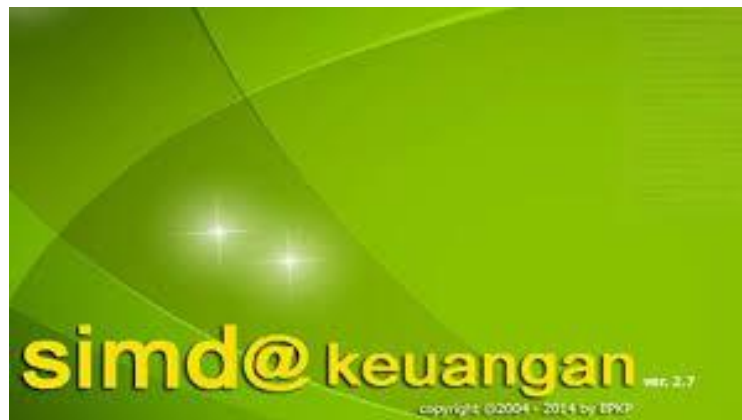
Gambar 2. Tampilan Halaman Panduan Aplikasi SIMDA Keuangan